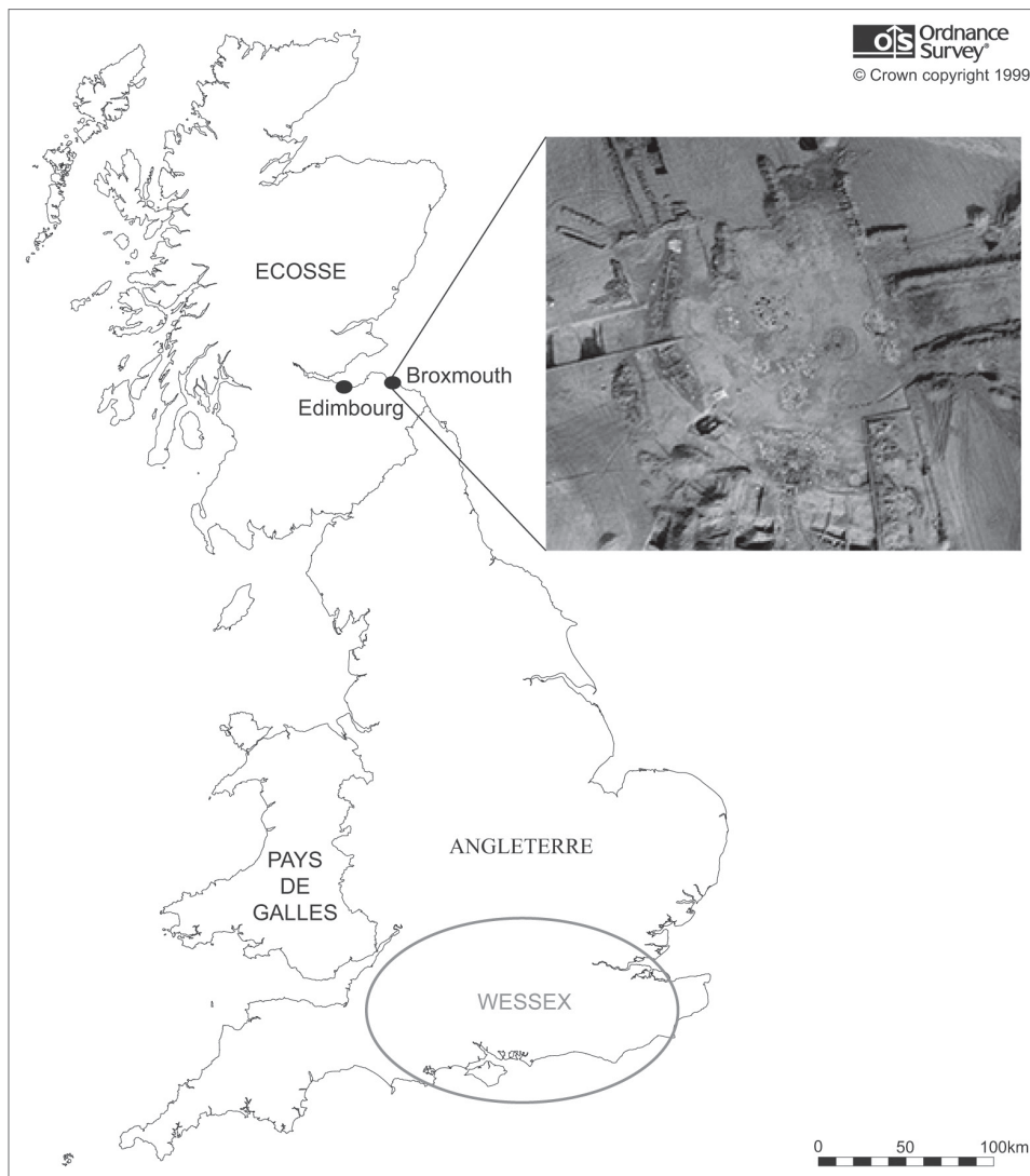
Illustration 1 : Carte de localisation du site de Broxmouth, avec une photo de l'emprise de la fouille.

1997). Cette même caractéristique a ensuite été utilisée pour restituer la répartition des différents secteurs d'activité à l'intérieur de l'édifice (par exemple Parker Perason, Sharples 1999, p. 22, Fig. 1:10). Ces modèles ont cependant été considérés comme excessivement structuralistes et par trop basés sur le recours aux données ethnographiques, au détriment de l'étude des processus taphonomiques (par exemple Pope 2007 ; Webley 2007).