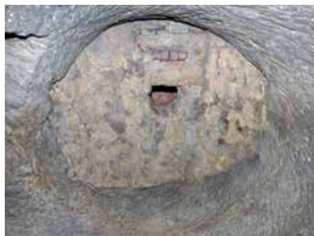
Obr. 7. Hrad Houska, k. ú. Houska. Sklenutí ve spodním ústí hrdla džbánovitého objektu narušeného nově vysekaným sklepem.

Druhý džbánovitý objekt zjistilo ohledání suterénu při archeologickém výzkumu hradu Úštěku v roce 2013. K jeho interpretaci přispěl následný archeologický výzkum v roce 2016, prováděný při opravě severního křídla hradu, pod kterým se objekt nachází. Majitel hradu nechal objekt vysekat na nádvoří při severní hradební zdi. Zdá se, že později, nejspíše někdy na přelomu 15. a 16. století, proběhla