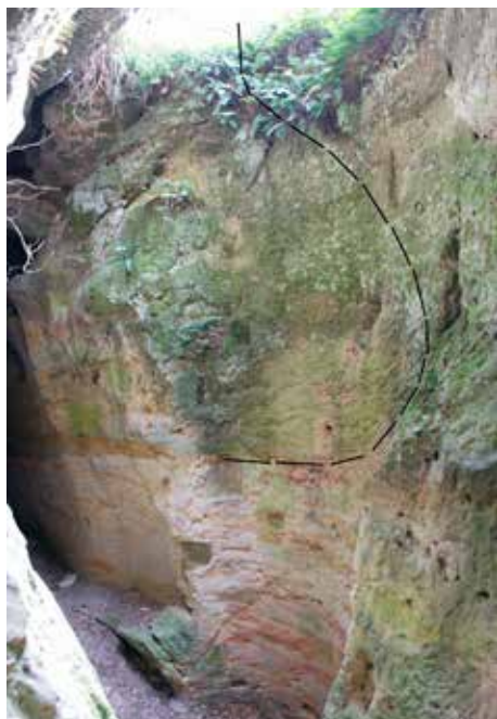
Obr. 5. Hrad Kvítkov, k. ú. Kvítkov. Západní stěna studny se stopami džbánovitého objektu s odstraněným hrdlem. Pohled od severu.