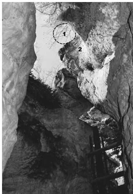
Obr. 6. Hrad Kvítkov, k. ú. Kvítkov. Relikt hrdla džbánovitého objektu. 1 – domodelovaný relikt horního ústí hrdla, 2 – stěna hrdla. Pohled od jihu.