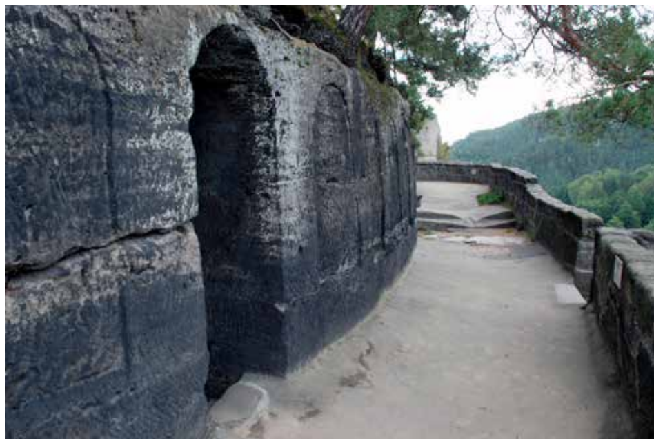
Obr. 1. Poustevnický kámen, k. ú. Sloup v Čechách. Vstup z jižní strany do džbánovitého objektu z mladší terasy s křížovou cestou.