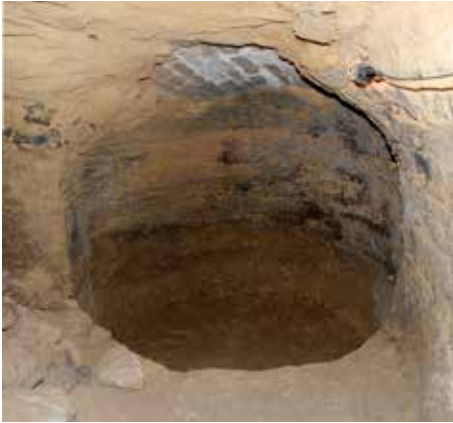
Obr. 11. Hrad Úštěk, k. ú. Úštěk. Relikty dřbánovitěho objektu po vybrání výplně pod úrovní podlahy.