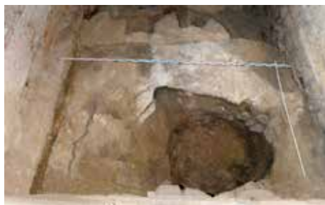
Obr. 9. Hrad Ústěck, k. ú. Ústěck. Mazaninová podlaha z bílé vápenné malty s „potrhanými“ plochami nad propadlou výplní džbánovitého objektu. Foto L. Kursová. Abb. 9. Burg Ústěck, Katastergebiet Ústěck. Lehm-Kalkmörtel-Fußboden mit „zerrissenen“ Flächen über der eingefallenen Verfüllung des krugartigen Objektes. Foto L. Kursová.