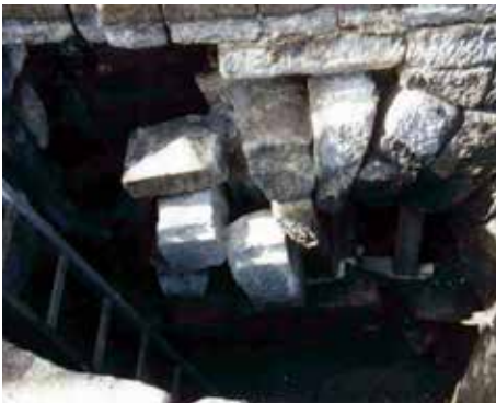
Obr. 4. Hrad Valdštejn, k. ú. Pelešany. Rozpadlá odlehčovací klenba nad horním ústím hrdla džbánovitého objektu na 1. díle hradu. Foto podle NZ Hrad Valdštejn 09-10/2002, 10/2003, foto 4.

Abb. 3. Burg Valdštejn, Katastergbiet Pelešany. Profildarstellung des krugartigen Objektes im ersten Burgteil. 1 – Mauerwerk des klassizistischen Gebäudes, 2 – mit Lehm ausgefüllte Risse. Zeichnung nach Hartman–Prostředník 2004, Abb. 6, bearbeitet von F. Gabriel.