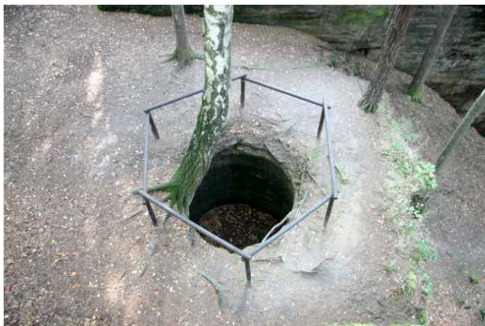
Obr. 2. Sídlo Kozlov-Chlum, k. ú. Olešnice u Turnova. Dochovaný relikt džbánovitého objektu po odtěžení horní partie.