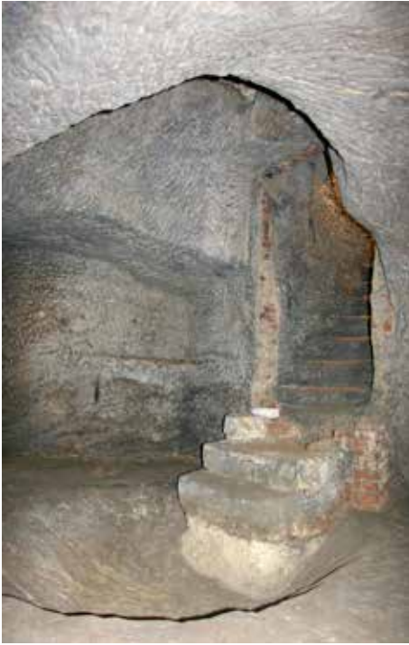
Obr. 8. Hrad Houska, k. ú. Houska. Podlaha džbánovitého objektu po zpřístupnění schodištěm, rozšířením do podoby sklepa a po odstranění výplně s dlažbou v průběhu výzkumu. Foto I. Peřina.

Abb. 8. Burg Houska, Katastergebiet Houska. Fußboden des krugartigen Objektes nachdem es mit einer Treppe zugänglich gemacht, zu einem Keller vergrößert und die Verfüllung mit der Pflasterung bei der Grabung beseitigt wurde. Foto I. Peřina.