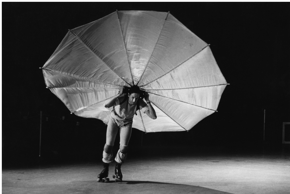
Obr. 2 Peter Moore: fotografie Roberta Rauschenberga performujícího v kusu Pelican ( Pelikán ) v newyorském televizním studiu CBS; 1965.