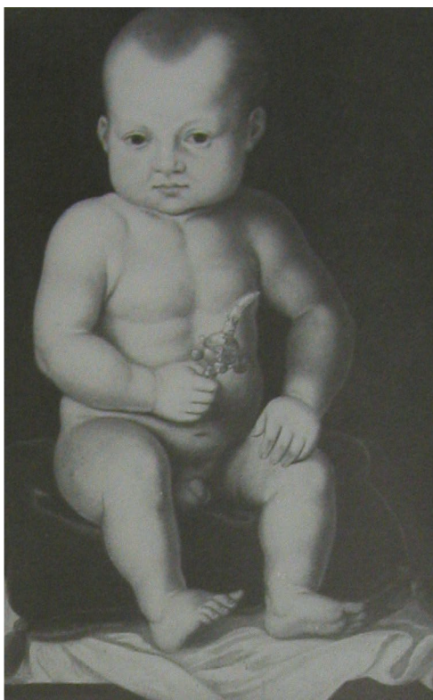
Obr. 104: Dítě s chrastítkem se zasazeným vlčím zubem, soukromá sbírka, foto: s laskavým svolením převzato z: Bott 1985, obr. 47.

Příkladem uplatnění devocionálií v lidové zbožnosti může být zvyk zavěšovat růžence na dětské postýlky nebo kolébky novorozenců. Takový magický amulet měl matku a novorozeně chránit před zlou mocí a dítěti zajišťovat boží milost (Omelka – Řebounová 2008, 893–894). To koresponduje s písemnými prameny. Pozůstalostní zápis olomoucké měšťanky Kláry Helzelové nás informuje o tom, že vlastnila „růženec se dvěma vlčími zuby“ (Něčková 1994, 187). Zuby dravců byly v magii používány, aby dodávaly odvahu a sílu, ale v tomto konkrétním případě sloužily pro batolata jako „cucací kámen“ k usnadnění prořezávání zubů (Watteck 2004, 30). Jak to vypadalo v praxi, ukazuje portrét batolete z doby kolem 1545 (obr. 104), přičemž tato tradice se udržela minimálně do 1. poloviny 18. století (Toranová 1976, obr. 62).