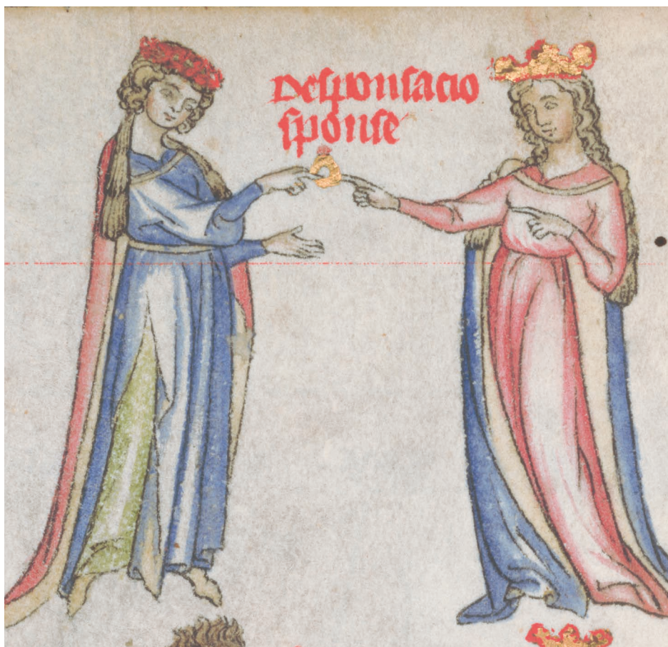
Obr. 100: Detail z iluminace Pasionálu abatyše Kunhuty, sign. MS XIV A 17, 3v, 1312–1321, Národní knihovna České republiky, foto: Národní knihovna České republiky.

prstenů nastal znovu ve 13. až 15. století, kdy byl do kamene většinou vyryt znak nebo jméno majitele, případně kombinace obojího (Biedermann 2008, 241). Bohužel z jižní Moravy známe až mladší příklady pečetních prstenů, jejichž zástupcem je například pečetní prsten mistra džbánkařského cechu z 18. století (obr. 101). Existenci pečetních prstenů z vrcholného středověku tak můžeme doložit alespoň písemnými prameny. Zajímavostí je odkaz pečetního prstene ještě nenarozenému dítěti, o kterém se dočteme v závěti bratislavského měšťana Ulricha Wyder z roku 1458. Ten stanovil, že jeho pečetní prsten dostane po narození jen dítě mužského pohlaví, v případě, že se narodí holčička, má se prsten dát bratrstvu Panny Marie (Majorossy – Szende 2010, č. 193, fol. 99v). Odkaz pečetního prstenu zmiňovanému bratrstvu nebyl výjimkou, jak potvrzuje závěť Hann-