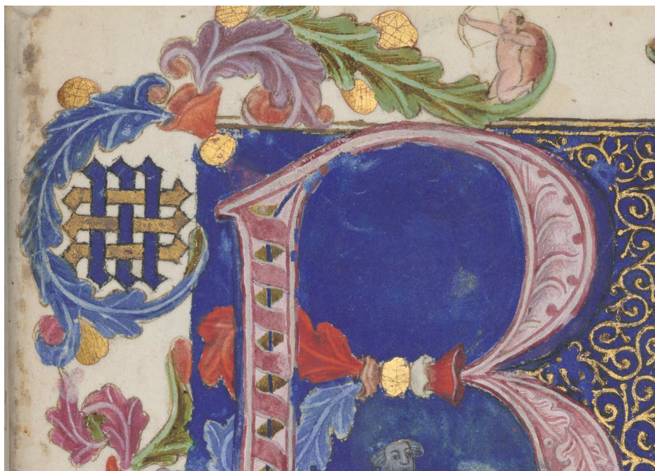
Obr. 107: Detail iluminace žaltáře sv. Floriana, sign. rps III 8002, fol. 3r, Mistr Hutterovy bible, pozdní 14. a počátek 15. století, Biblioteka Narodowa Warszawa