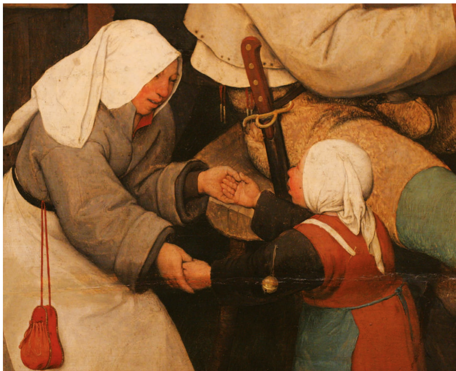
Obr. 106: Detail z obrazu Selská svatba, Pieter Bruegel st. (1525–1569), kolem 1567, Kunsthistorisches Museum Wien, foto: Věra Šlancarová.