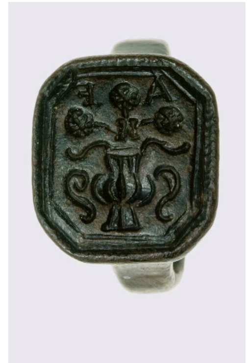
Obr. 101: Pečetní prsten džbánkařského cechu, 18. století, Muzeum Vyškov, foto: Muzeum Vyškov.

S rytířstvím, ale i odvahou, rychlostí, vytrvalostí a věrností je spojován kůň. Byl věrným přítelem a služebníkem nejen světských osob, ale stal se atributem i mnohých světců (Rulíšek 2005, nestr.). V našem souboru zdobil příchytnou destičku přezky z Josefské ulice v Brně (kat. č. 17.4.69) a knoflík ze Štěpánova