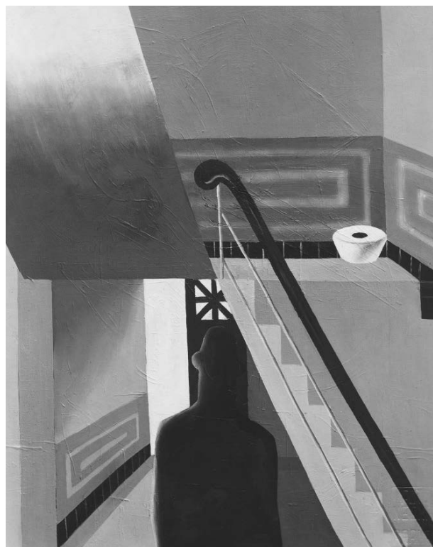
2 – Zdenek Rykr, Schodiště , černobílá fotografie nezvěstného obrazu, 1928 nebo 1929. Praha, Archiv Ústavu dějin umění Akademie věd ČR

Ve svém textu v katalogu retrospektivy z roku 1937 toto své období popsal následujícími slovy: „ Jsou to pro mě léta těžké krise a otázek, co jest skutečnost? Co jest forma? Jaký je vlastně smysl malby. Napsal jsem o tom článek do Přítomnosti, místo abych pořádně maloval. Naštěstí přišlo zase jednou jaro 1929. Unaven suchým, plošným a věcným kubismem, kterým jsem opět chtěl získat trochu jasna v té živé tříšti, do které jsem se dostal, povolil jsem obrazu i sobě a začal jsem malovat zcela opačně: úplně volně [...] “ Všimněme si, že on sám tedy toto období charakterizuje jako „kubismus“ a že v přívlastcích se vedle „suchý a plošný“ objevuje i termín „věcný“. Už dopředu mohu prozradit, že to je jediná narážka na „věčnost“ v jeho textech.