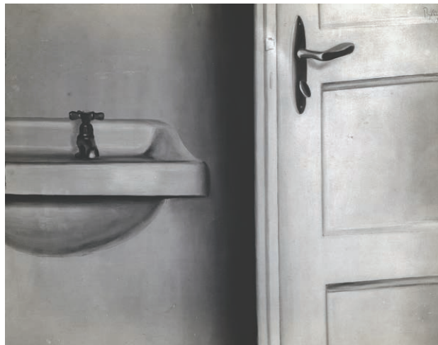
3 – Zdenek Rykr, Umyvadlo , černobílá fotografie nezvěstného obrazu, 1929.

Existují tedy alespoň určité paralely mezi jeho tehdejšími obrazy a německou novou věcností? U Rykra, který jako výtvarník spolupracoval s průmyslem a rozhodně nebyl levicově orientovaný, se v jeho umění neobjevují žádné sociálně-kritické aspekty, které tak často nacházíme v dílech umělců nové věcnosti. Ale třeba u hannoverské skupiny, kterou Sergiusz Michalski charakterizuje jako určitou vý-