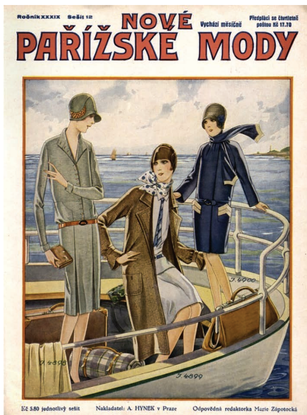
4 – Nové pařížské mody , obálka časopisu, 1926–1927, č. 12

umění transcendence, specifického pro starší expresionistické proudy, k umění imanence – tedy k umění všednosti – přispělo k destabilizaci tradičních genderových kategorií a tak i k nebývalé tvůrčí a existenciální svobodě. (Za což bylo pochopitelně z konzervativních a následně především z národněsocialistických pozic kritizováno jako projev dekadence a degenerace.) „Šok z modernity“ byl v Německu často vnímán jako krize tradiční mužské autority, moci a identity. Avšak tradiční koncept ženské identity byl pod stejným, ne-li ještě větším tlakem. Ženská identita se na kulturní scéně tematizovala a debatovala nejen s ohledem na mužský strach z modernity a z „nové ženy“, ale rovněž proto, že samy ženy byly konfrontovány s novými volbami a možnostmi stejně jako s novými stresy a břemeny. [...] Nic nesymbolizovalo novou věcnost lépe než pracující, sexuálně emancipovaná a nesentimentální „nová žena.“ 5