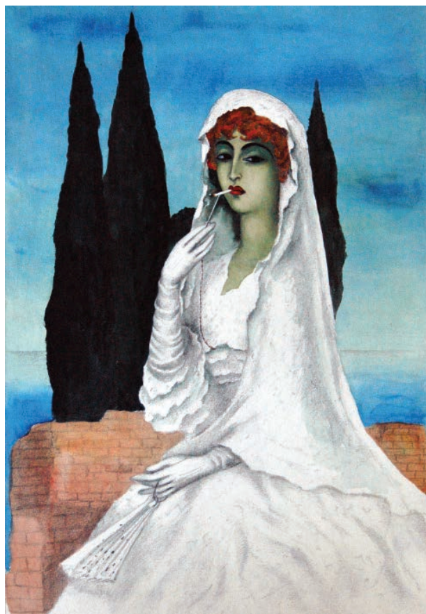
7 – Milada Marešová, Kouřící nevěsta , 1931. Soukromá sbírka

ukáže nesrovnalost mezi skutečnými životními hodnotami a groteskní píli přehnaných maličkostí. 10