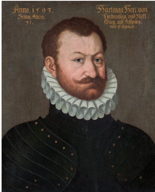
Abb. 1. Unbekannter Maler, Porträt des Hartmann II. von Liechtenstein, 1593 Inv.-Nr. GE 1168

Eine besonders aktive Rolle spielte Karl als protestantischer Ständepolitiker in Mähren: Seit 1593, dem Jahr, in dem mit der Schlacht bei Sissek (Sisak) der „Lange Türkenkrieg“ begann, übte er verschiedene Ämter im Auftrag der mährischen Stände aus. 1593 und 1596 wurde er zum Hauptmann des Kreises Ungarisch Hradisch (Uherské Hradiště) gewählt. 1595 wurde er als Vertreter der Brüderunität Besitzer des Größeren Landrechts. Beim „Fasten-Landrecht“ des Jahres 1599 in Brünn wurde Karl auf Antrag der Stände vom Kaiser zum Oberstlandrichter von Mähren bestellt. 18 Karl galt zu diesem Zeitpunkt als Hoffnungsträger im protestantischen Lager Mährens. 19