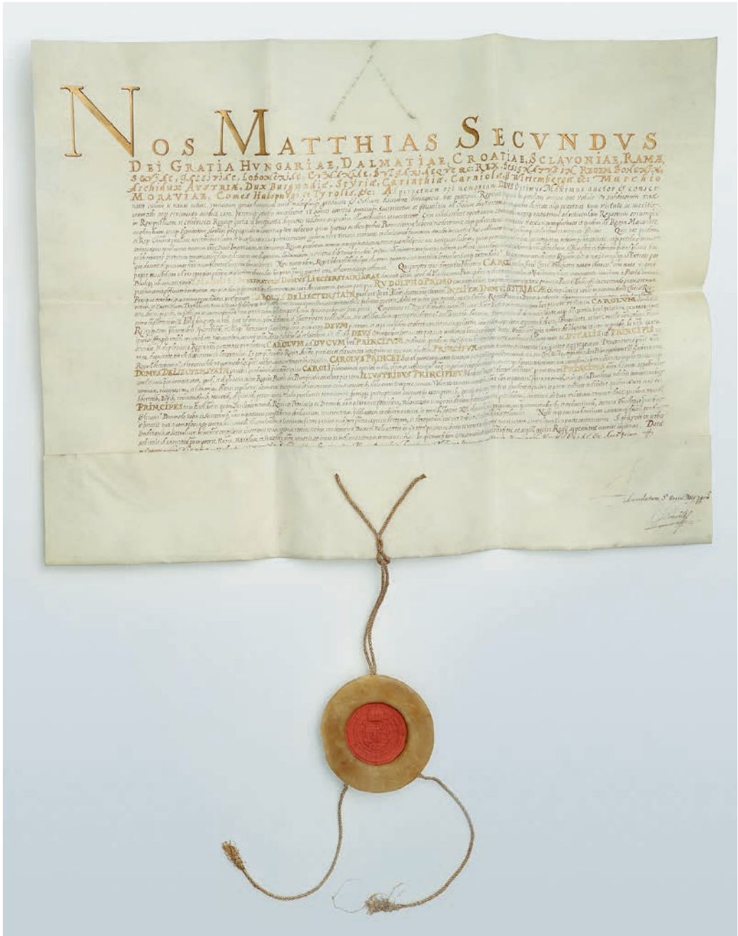
Abb. 3. Matthias, Erzherzog von Österreich und König von Ungarn, erhebt Karl von Liechtenstein in den erblichen Fürstenstand. Wien, 20. 12. 1608. LICHTENSTEIN. The Princely Collections, Vaduz-Vienna, Inv.-Nr. UR 1608.12.20.