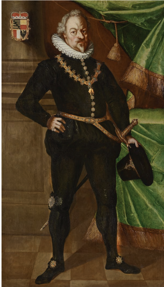
Abb. 2. Unbekannter Maler, Porträt des Fürsten Karl I. von Liechtenstein, um 1625.