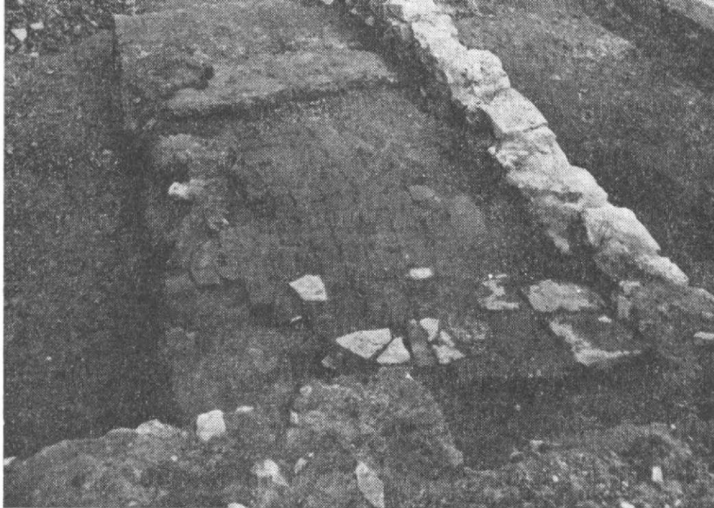
Obr. 6. Fragment terakotové podlahy v západní části konventního kostela. Na jižní straně dlažba poškozena vkopem pro recentní zdivo na obrázku rovněž patrné. Pohled od Z.