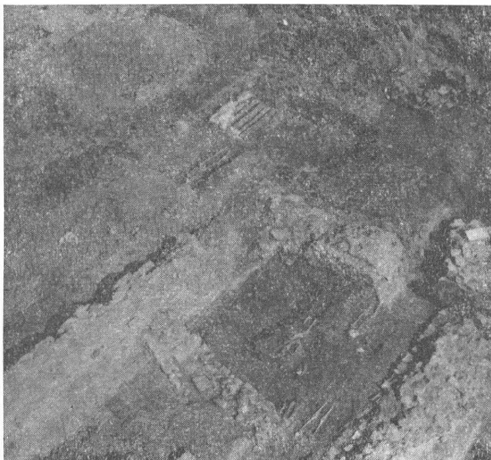
Obr. 5. Východní část sakristie a konventního kostela s recentními objekty. Pohled od JZ.