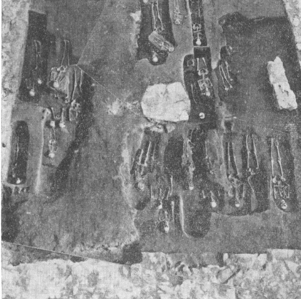
Obr. 1. Pohled od západu do prostoru kostelního provizoria – kapitulní síně.

nutně uvažovat o dvojlodním prostoru, souvisejícím s nalezeným presbyteriem.