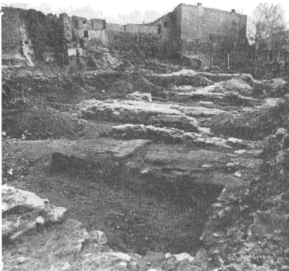
Obr. 7. Pohled na výzkum od SZ rohu základové jámy. V popředí Z část konventního kostela.