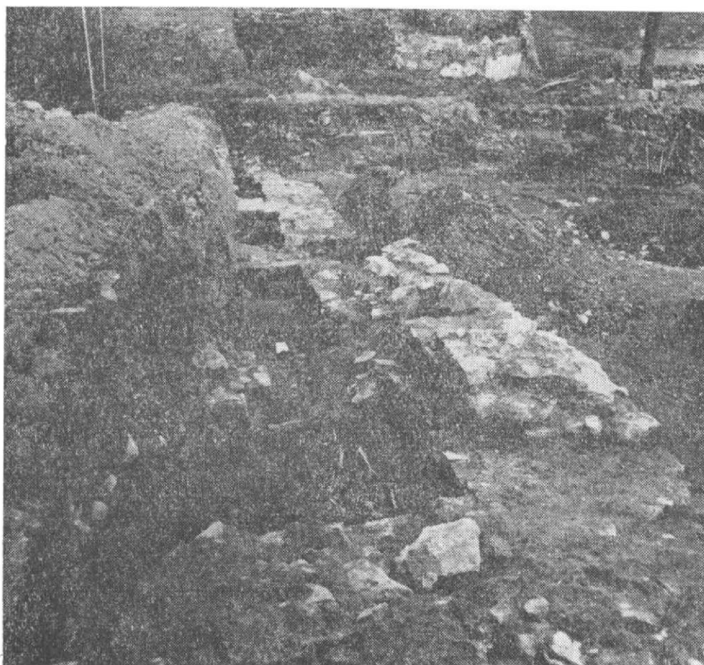
Obr. 3. Severní zdivo konventního kostela s opěráky a se zaoblenou bází šneku(?). Foto od západu.