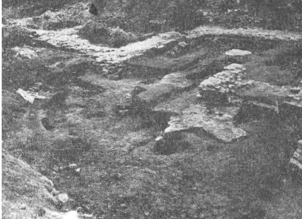
Obr. 4. Negativ zdiva a část základu s opěrákem krátkého presbyteria na východní straně provizoria – kapitulní síně. (Od JZ.)