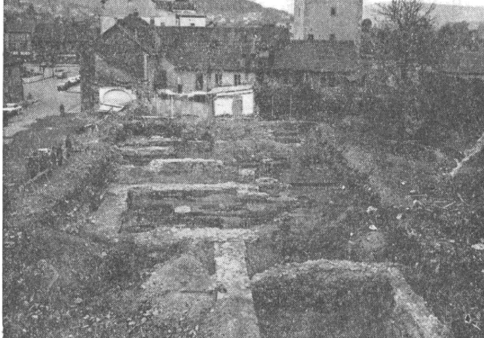
Obr. 2. Pohled na výzkum od jihu.