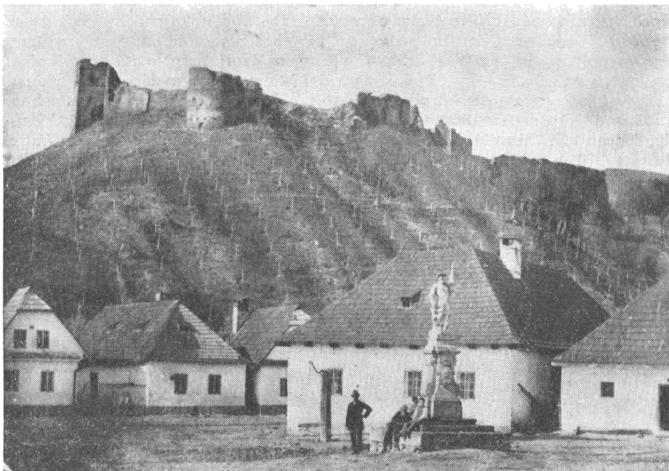
Obr. 1. Hrad Brumov. Celkový pohled z 2. poloviny 19. století.

První pokus o architektonický rozbor hradních zřícenin provedl K. Svoboda. Vycházel podstatnou měrou z práce Prokopovy a na lokalitě samotné provedl jen povrchový průzkum (Svoboda, 1948). V posledních letech došlo ke zvýšení zájmu o samotnou lokalitu v souvislosti s plánem využít areálu hradu ke kulturním účelům. V letech 1972–73 byla nákladem MNV Brumov postavena nová zeď na některých úsecích obvodu hradu (důvodem byla ochrana před padajícím zdivem dosud zachovalých objektů hradu) a zbudována stříška nad zbytky věže na jižním konci hradního areálu.