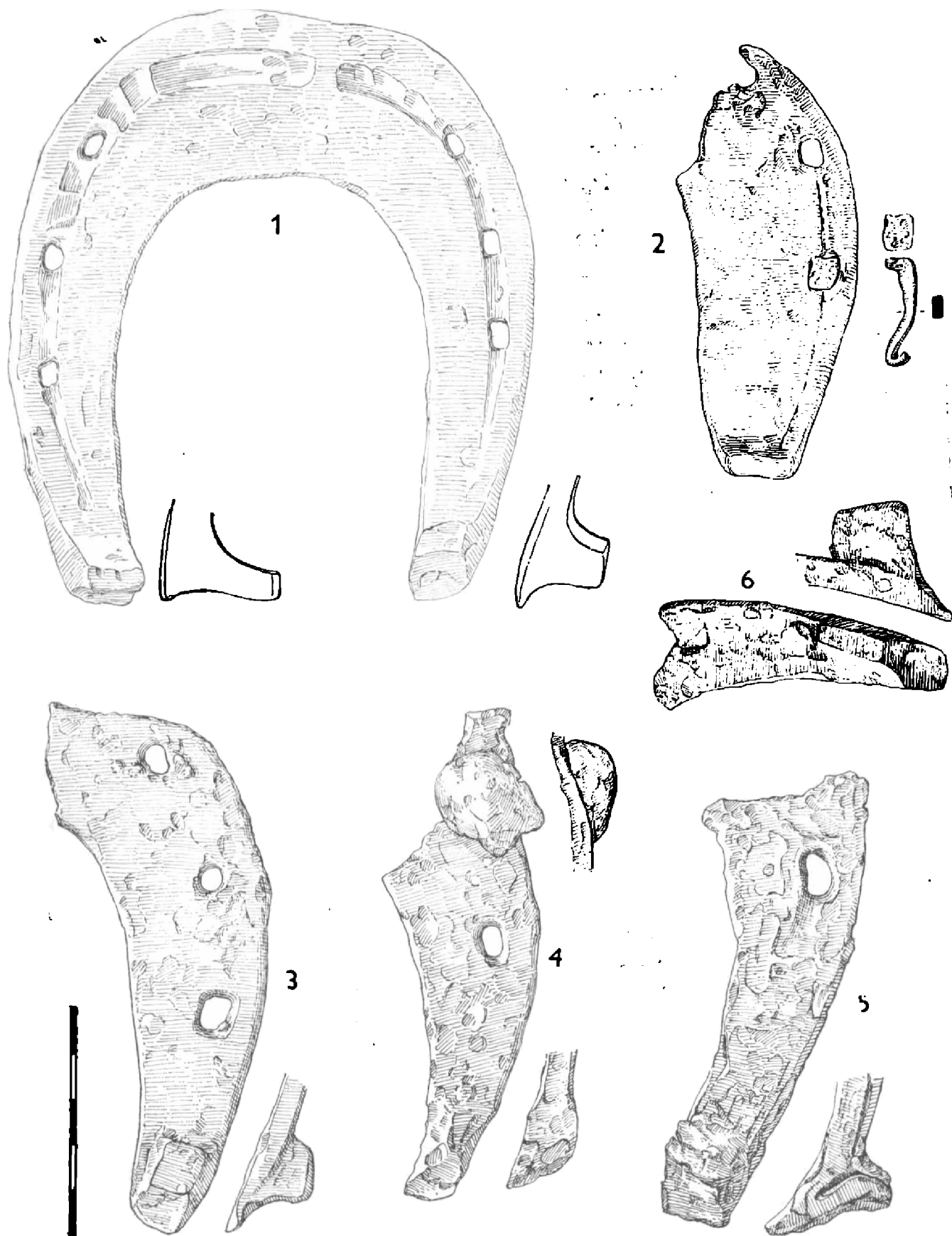
Obr. 2. Sředověké podkovy z Konůvek. 1 – typ podkovy s drážkou, z pravé nohy koně, s ozuby: vyšším a ostřejším na vnější straně, nižším a tupým na vnitřní straně končetiny, 2 – podkova s jednoduchým ozubem a utkvělým podkovákem, 3 – podkova bez drážky s výrazným ozubem, 4 – podkova s nízkým ozubem a boční „štůlnou“, 5 – tzv. klínový ozub, vykováný zpětným přehnutím podkovového pásku dolů a šikmo vpřed, s plochým zahrocením konce ramene, 6 – podélně vykováný hranolový ozub.