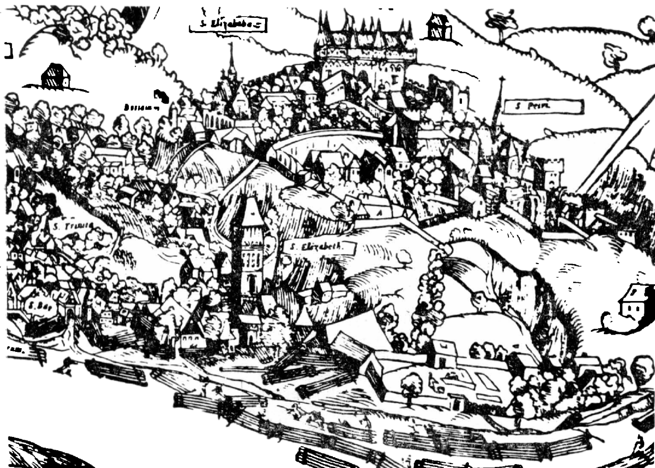
Obr. 2. Výsek z dřevorytu J. Kozla a M. Petrla z Annaberku z roku 1562 – detail vyšehradského hradiště a Podvyšehradí.