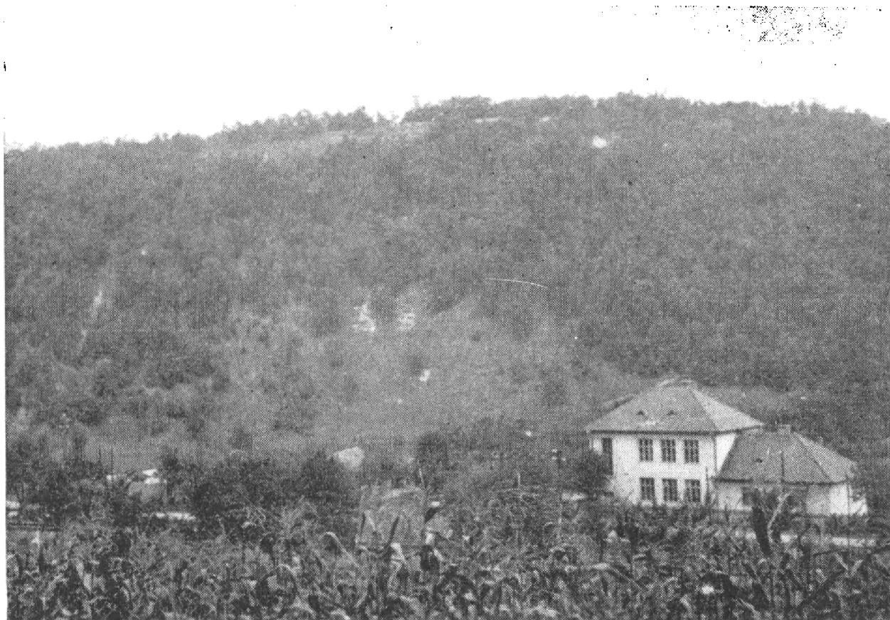
Obr. 1. Šiatorská Bukovinka (okr. Lučenec), pohľad na výšinný stredoveký hrádok od západu.

Hrádok leží južne od Filakova, asi 2 km od štátnych hraníc ČSSR a Maďarska (medzi spojenými dnes osadami Šiatorošom a Bukovinkou) a to nad úzkou, horskou úžinou medzi kopcovitými výbežkami východnej časti Novohradských vrchov zvanými Karancs a Medves. Na dne úžiny sa prediera malý potok šiatorošský, stará cesta a v miernom záreze dnes už aj železničná trať. Opevnenie hrádku bolo vybudované na východnej strane úžiny nad strmou 20—25 m vysokou skalnou stenou, ktorá vytvára typickú, výšinnú a ostrožnú polohu hrádku s dobrým pohľadom na juh i juhozápad (obr. 1).