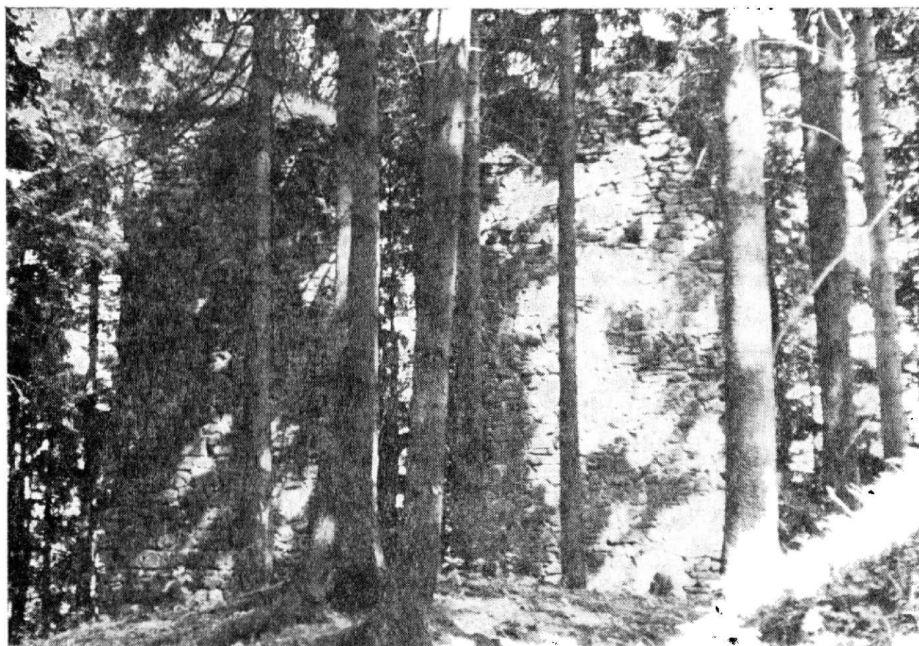
Obr. 3. Nádvořní zeď paláce od jihu v roce 1968 (výška 6 m, délka 10 m).