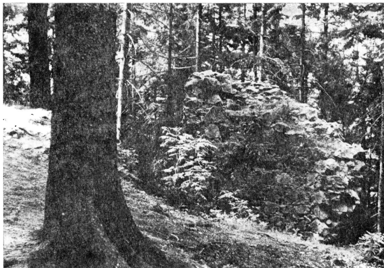
Obr. 6. Zbytek půlválcové věžice od východu.