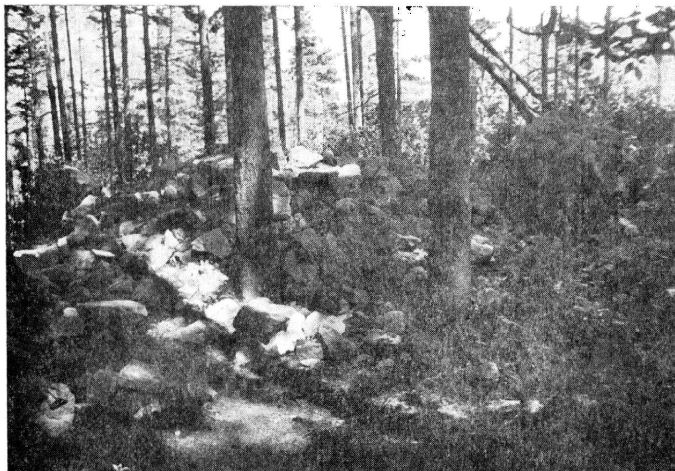
Obr. 4. Zbytky paláce v roce 1982. Srovnání s předchozím snímkem dokládá intenzitu chátrání našich hradů.