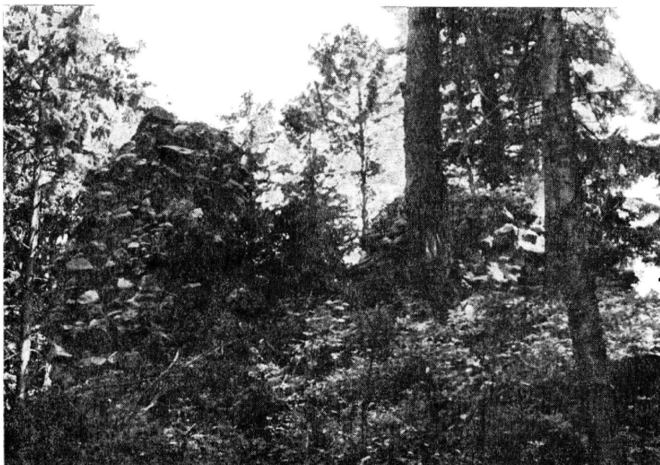
Obr. 8. Relikty půlválcové věžice (vlevo) a štitové zdi od západu.