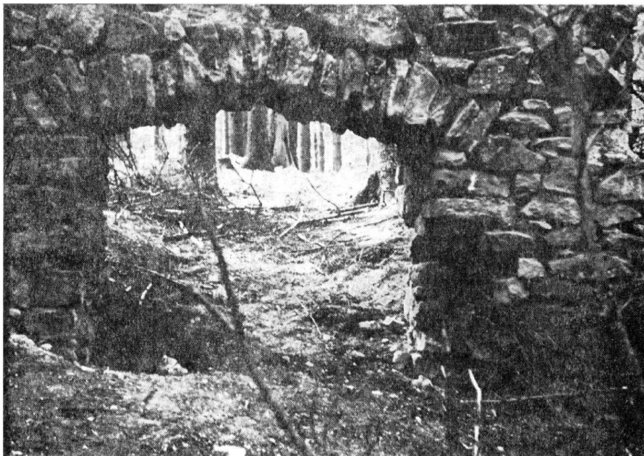
Obr. 5. Polozasypaný portál paláce hradu.