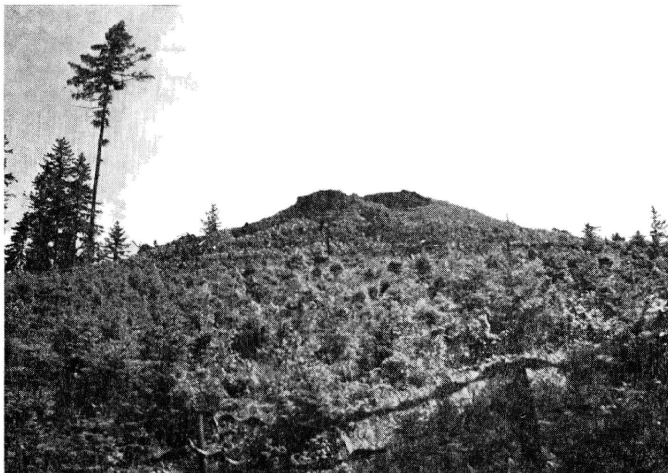
Obr. 7. Odlesněný skalnatý pahorek vysunutého opevnění od severozápadu.