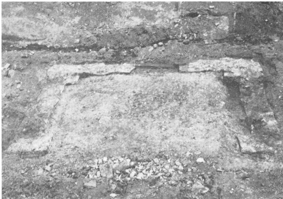
Obr. 2. Zachované murivo kamenného domu z 15.–16. storočia v centrálnej časti Hlohovca.