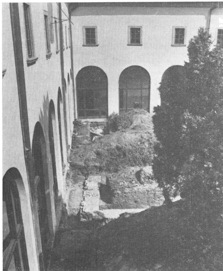
Obr. 1. Základové murivo stavby, odkryté vo vnútornom dvore pôvodného fran-tiškánskeho kláštora.

Pôvodným feudálnym vlastníkom Hlohovca bol panovník, no od r. 1275 patril príslušníkom mocných feudálnych rodov. Z hlohovského hradu spravovali mesto a rozsiahle feudálne panstvo na jeho okolí Ujلاكovci, Thurzovci, Forgáčovci, páni z Mitrovíc a Erdödyovci.