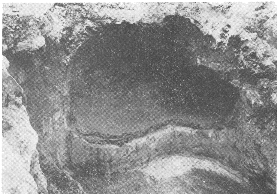
Obr. 3. Časť pece na Podzámskej ulici. 12.–13. storočie.