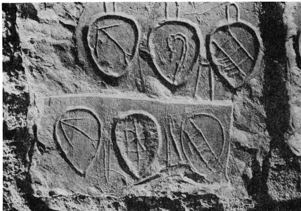
Obr. 3 Detail erbů na rytině č. 39. Stav po odkrytí v r. 1959.