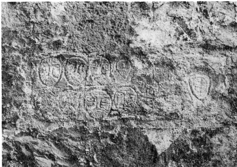
Obr. 6. Mužské obličejce a dva erby na rytině č. 20. Stav v r. 1983.