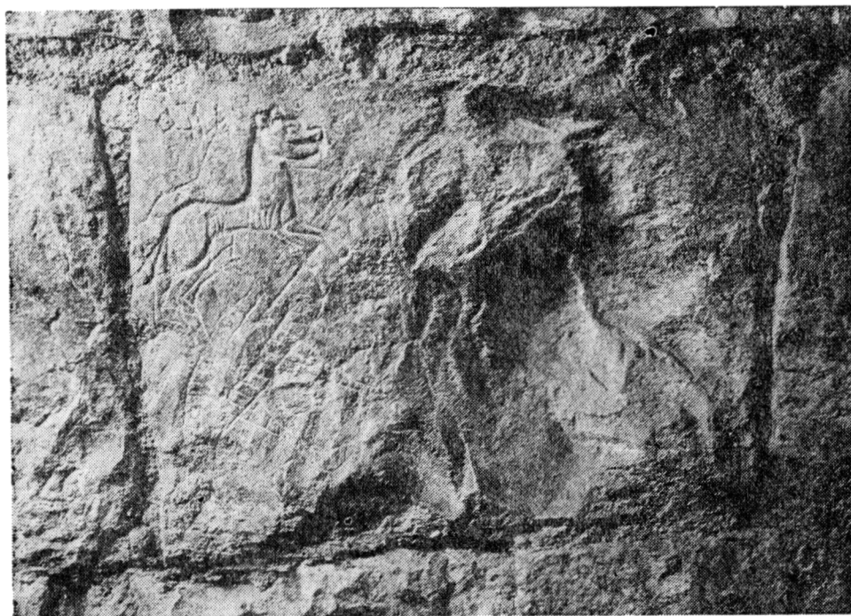
Obr. 7. Běžící pes na západní stěně Interiéru. Stav v r. 1983.