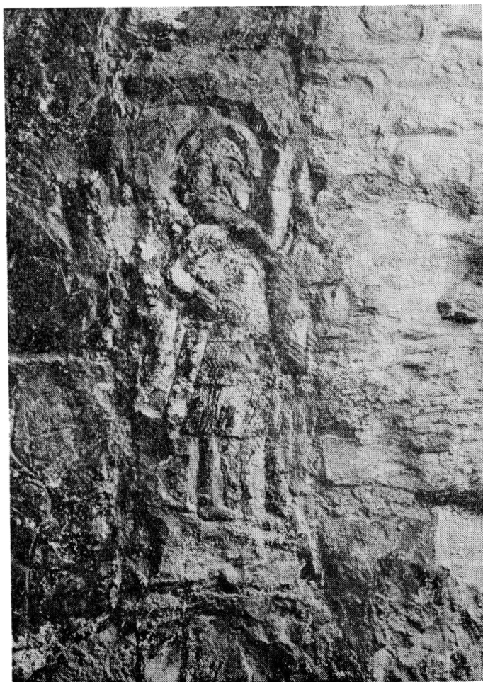
Obr. 5. Ozbrojenec na rytině č. 16. Stav v r. 1983.

Pokládáme-li za původce rytin vítěznou stranu konfliktu, čemuž nasvědčuje znak Hradišiců jako erb nejvěrnějšího příslušníka Václavovy družiny Boreše z Rýzmburka, nabízí se otázka ztotožnění dalších šlechtických bojovníků královského vojska. Jména dvou hlavních straníků Václavových známe z Dalimilovy kroniky (FRB III, 180), kde je vedle zmíněného Boreše uváděn