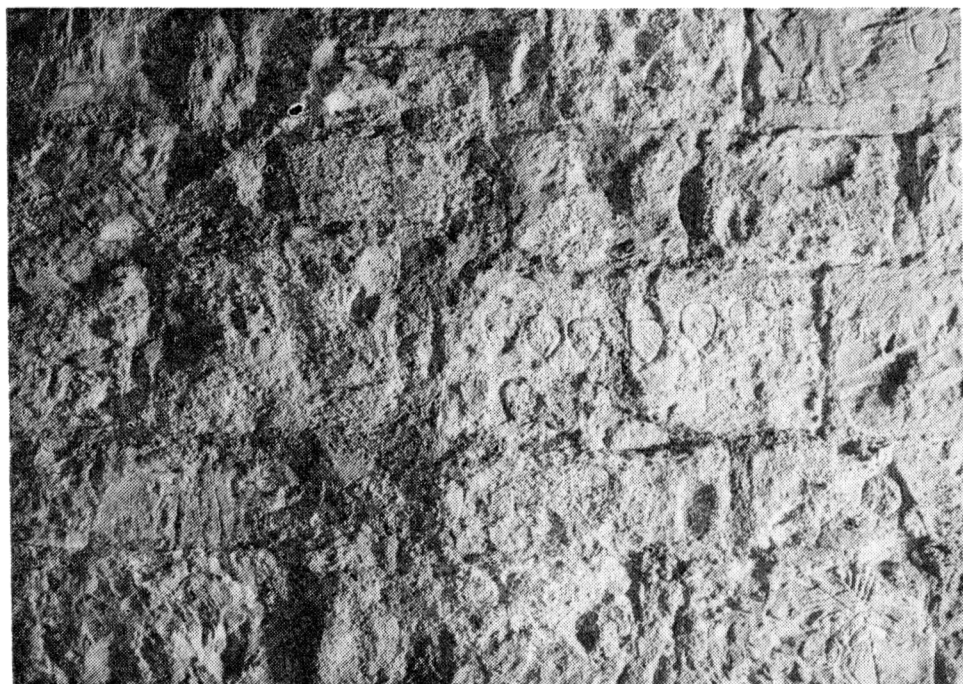
Obr. 2a a 2b. Srovnání stavu rytin po odkrytí a v roce 1992. Uprostřed záběrů rytiny s erby č. 38 a 39, vpravo nahoře zkřížené hrábě na rytině č. 46, vpravo dole jelen na rytině č. 21.