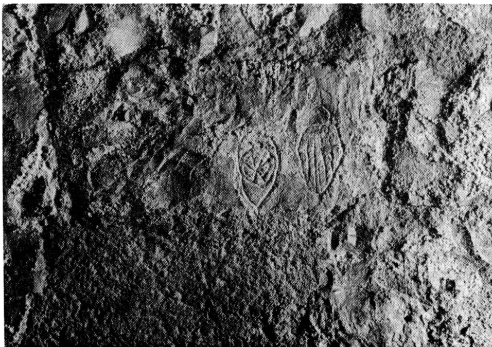
Obr. 4. Erby se stylizovanými přilbami na rytině č. 41. Stav v r. 1992.