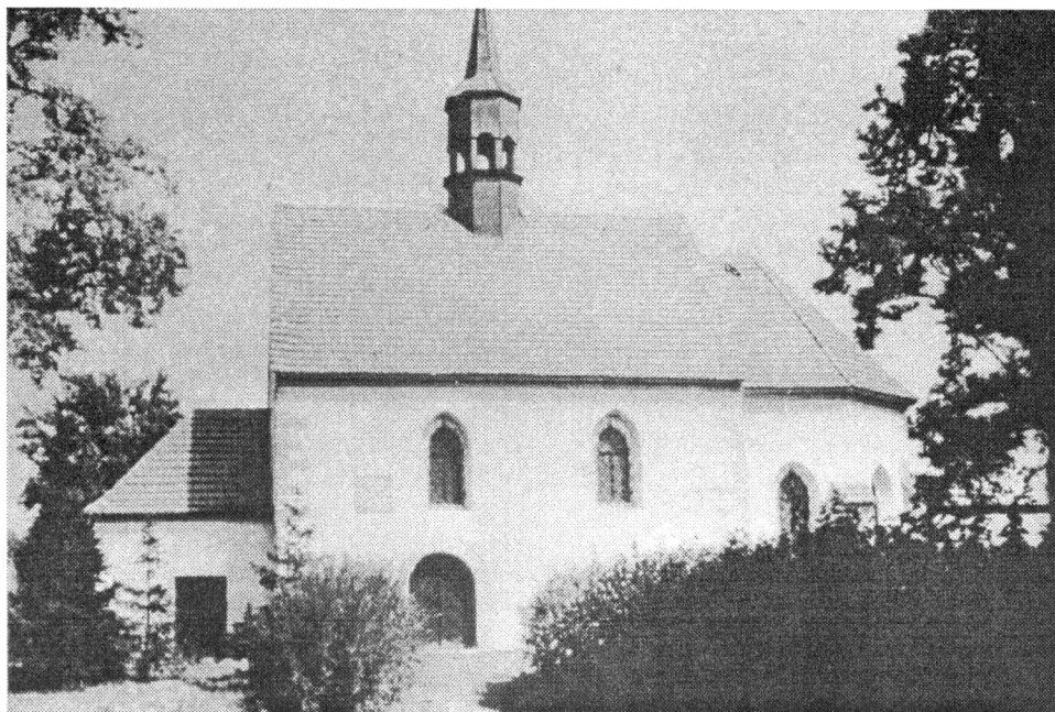
Obr. 2. Kostel sv. Jiljí, situovaný 1 km západně od historického jádra Rakovníka.

Četné odpadní jámy vyplněné zlomky keramiky a nález hrnčářské formičky (Ježek 1994) dovolují spojovat zkoumanou plochu s působištěm hrnčářů, jejichž dílny daly název původní středověké ulici.