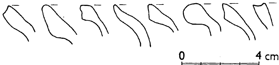
Obr. 3. Výběr z nejstarších keramických zlomků získaných při výzkumu na nádvoří Okresního musea v Rakovníku, nám. Jana Žižky, čp. 1.

Z výsledků archeologických výzkumů vyplývá, že část území dnešního Rakovníka byla ve středověku osídlena nejpozději v mladší fázi 1. poloviny 13. století. Na základě našich poznatků můžeme dále vyslovit několik poznámek k počátku města (za cenné pod-