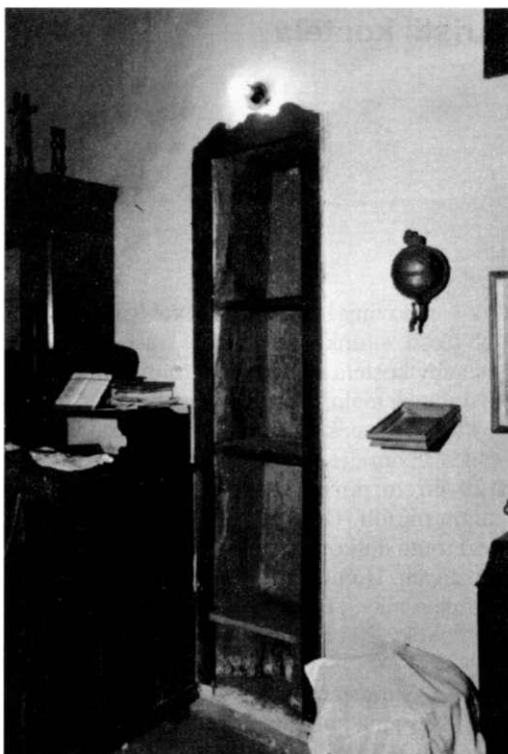
Obr. 2. Celkový pohled na niku ve stěně sakristie.