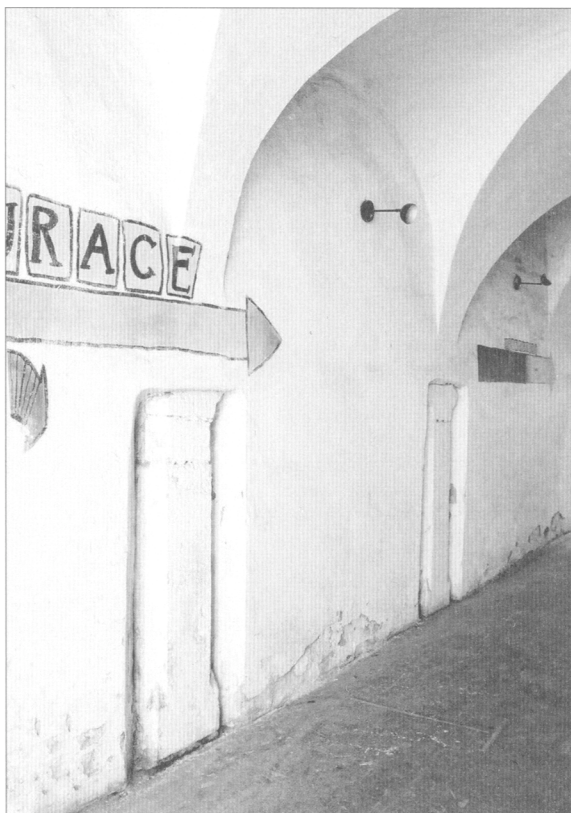
Obr. 6. Jakubská 7. Pohled na jihovýchodní zeď sklepa s portálkem výstupu a vstupem do nižšího patra suterénu.