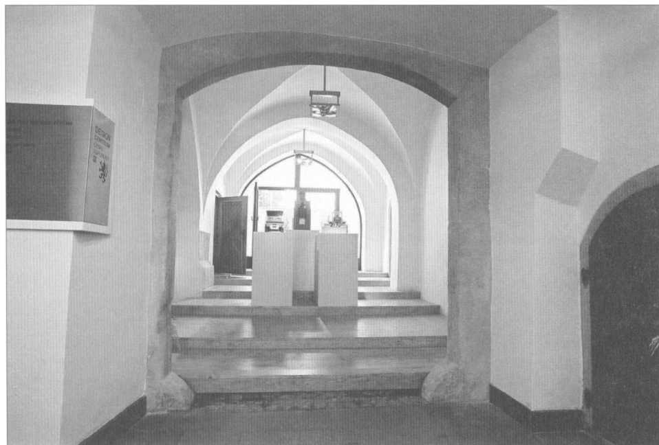
Obr. 4. Radnická 2, přízemí. Pohled z V na segmentově zaklenutý portál v odsazené Z části průjezdu.

zničení v Brně unikátních hrázděných příček a tedy devastace interiéru představuje nedávná rekonstrukce domu Mečová 8.