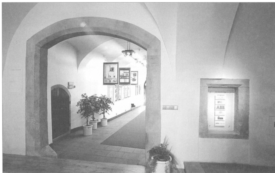
Obr. 3. Radnická 2, přízemí. Pohled ze Z do východní části průjezdu přístupné segmentově zaklenutým portálem.