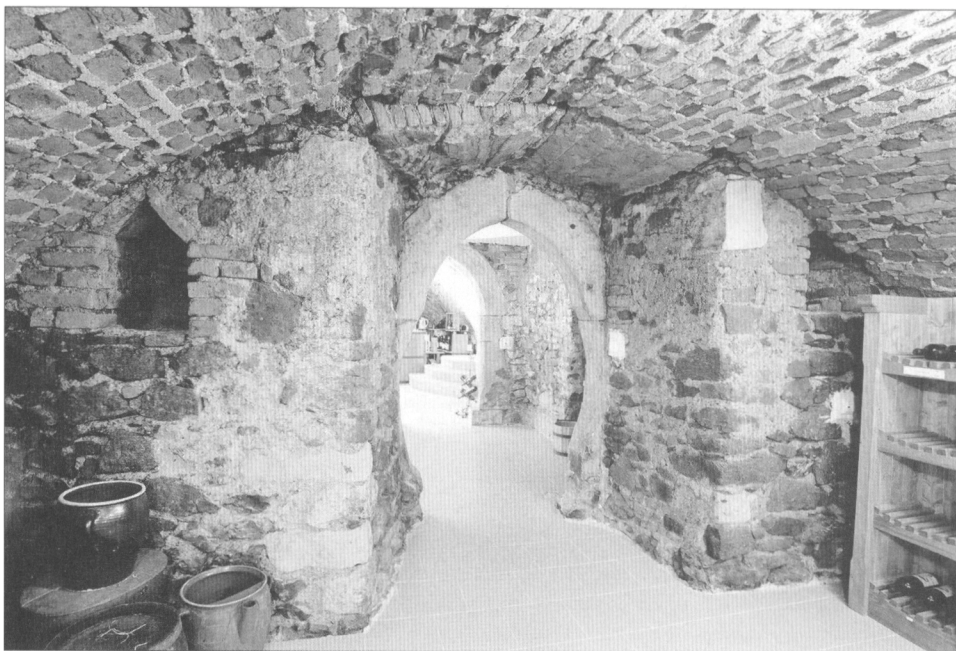
Obr. 2. Minoritská 2, suterén, přední místnost jižního jádra s gotickým zdívkem a portálkem, pohled z V.