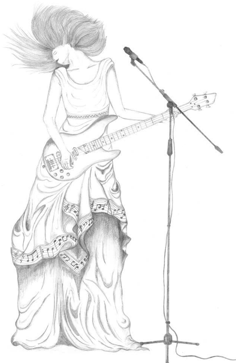
Sedm svobodných umění - hudba, Adriana Peremilovská, © 2019