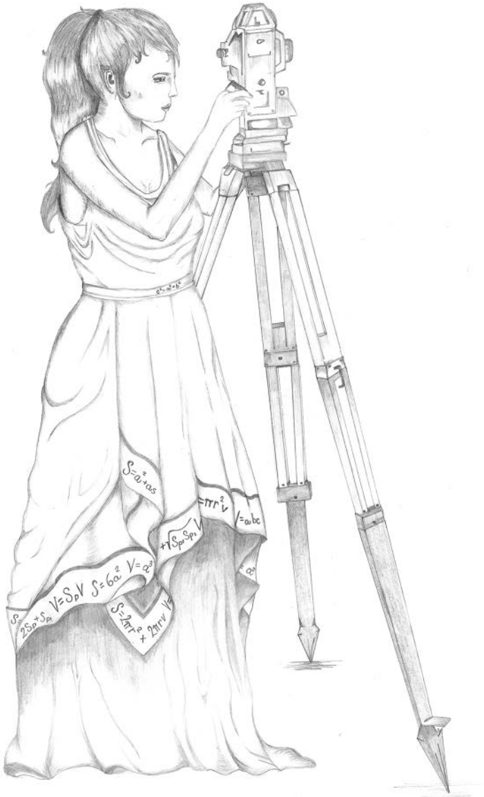
Sedm svobodných umění – geometrie, Adriana Peremilovská, © 2019