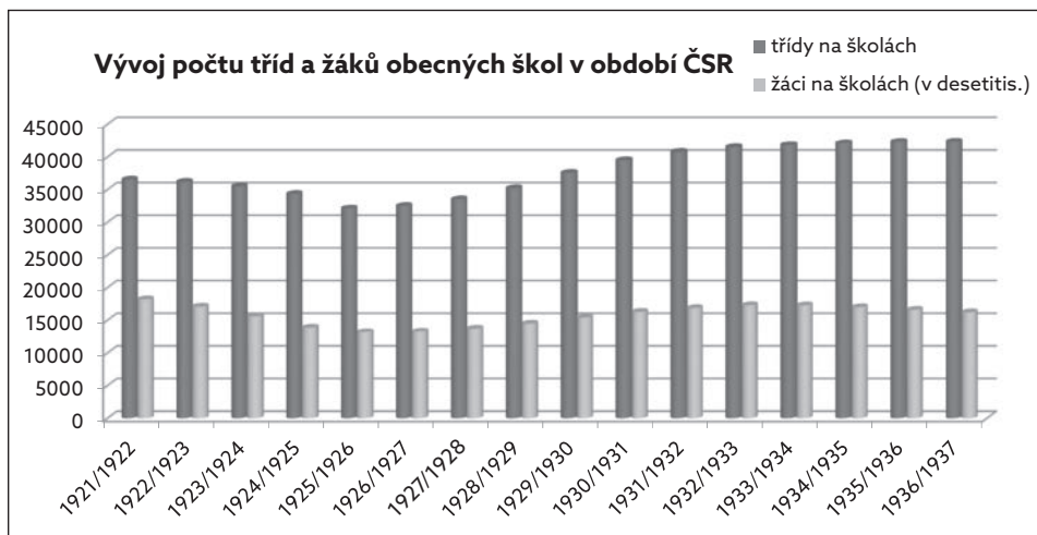
Graf č. 2 Vývoj počtu tříd a žáků obecných škol v období první Československé republiky (na základě dat Historická statistická, 1985)

Důležitým ustanovením zákona pak bylo upozornění, že tato právní norma je platná pro všechny veřejné obecné a měšťanské školy bez ohledu na to, kým byly zřízeny a udržovány (ibid). Z hlediska tématu této knihy to například znamenalo, že jakékoliv menšinové školy se musely řídit tímto zákonem a dalšími nařízeními, která tento zákon dále doplňovala. Tedy například i prováděcími