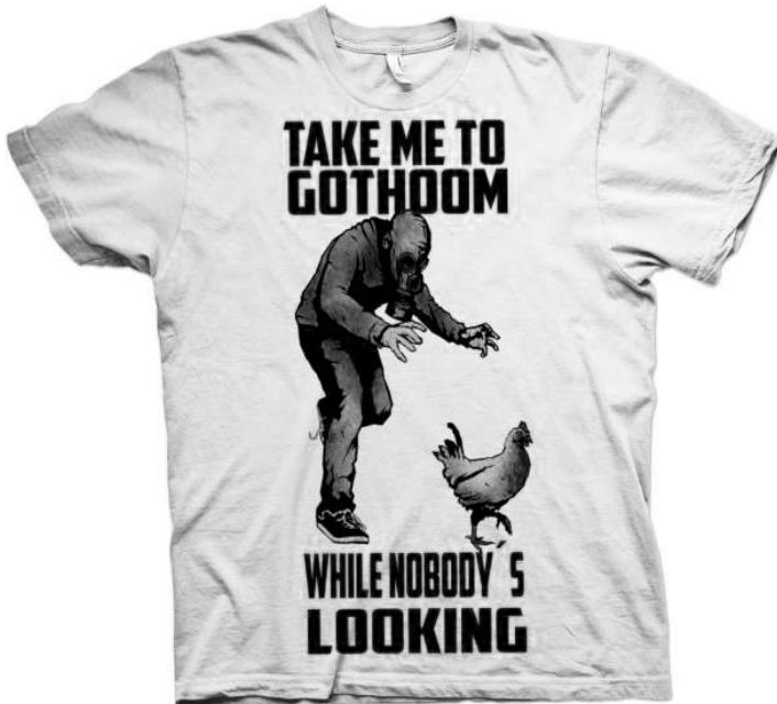
Obr. 3. Tričko predávané na festivale.

Medializácia festivalu so sebou priniesla aj vyjadrenia rôznych ľudí, autorov, či aktivistov, ktorí označili účastníkov festivalu za satanistov. Satanizmus sa skloňoval v rôznych vyjadreniach a klebety prišli z viacerých strán a niekedy pôsobili až kuriózne. 13