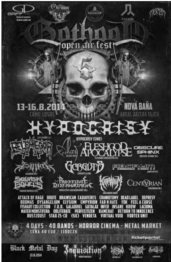
Obr. 2. Gothoom plagát 2014.