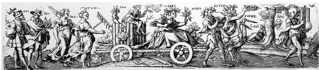
11 – Virgil Solis, Triumfální průvod Léta , dřevorez, kolem roku 1560

Jednoznačně protestantská interpretace těchto typologických motivů – vody trestající a vody omilostňující – podporuje dataci sgrafit do šedesátých let 16. století také v relaci dějinných událostí města Mikulov. Roku 1561 postihl