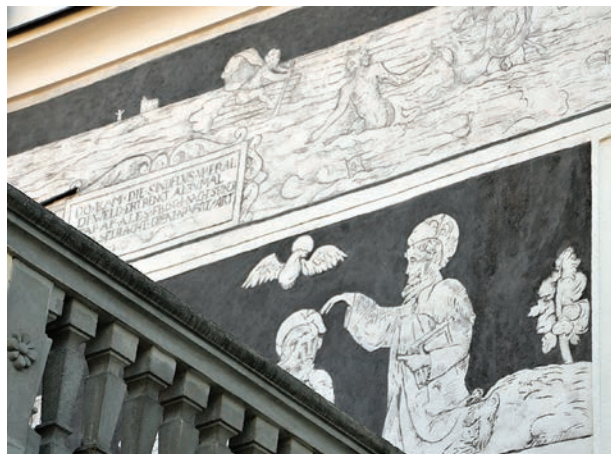
14 – Křest Krista, sgrafito. Mikulov, Náměstí, dům č. 24, východní fasáda, první patro

V levé části nádvorního průčelí sgrafita destruovala schodiště vedoucí na arkádovou chodbu a jeho zastřešení. Srovnání dochované končetiny fragmentárního obrazu s kompletní Behamovou sérií biblických ilustrací napovídá,