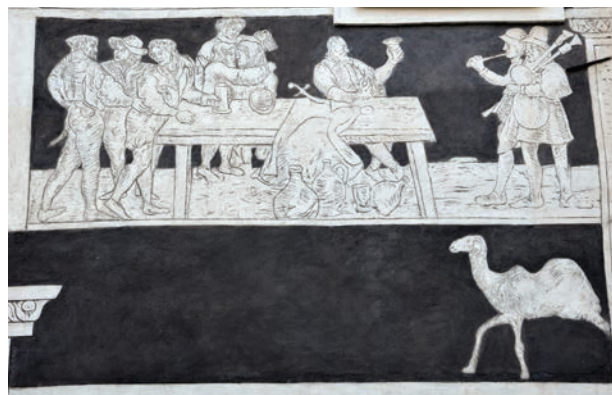
2 – Hodovní scéna, velbloud, sgrafito. Mikulov, Náměstí, dům čp. 24, severní fasáda, pás mezi okny přízemí a prvního patra