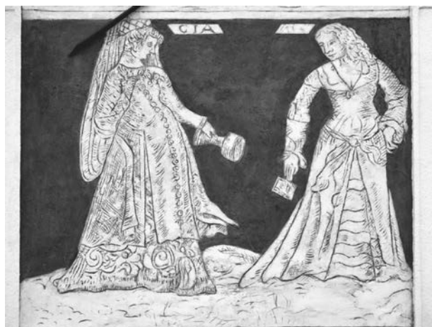
8 – Pošetilé panny / Grecia a Hispania, sgraffito. Mikulov, Náměstí, dům čp. 24, severní fasáda, pole mezi okny prvního patra

Pod korunní římsou fasádu završuje pás s postavami antických božstev a dalšími mytologickými figurami. Některé z těchto personifikací byly převzaty z grafiky Virgila Solise s námětem triumfálního průvodu Léta s římskou bohyní setby a úrody Cererou v ústřední pozici na ale-