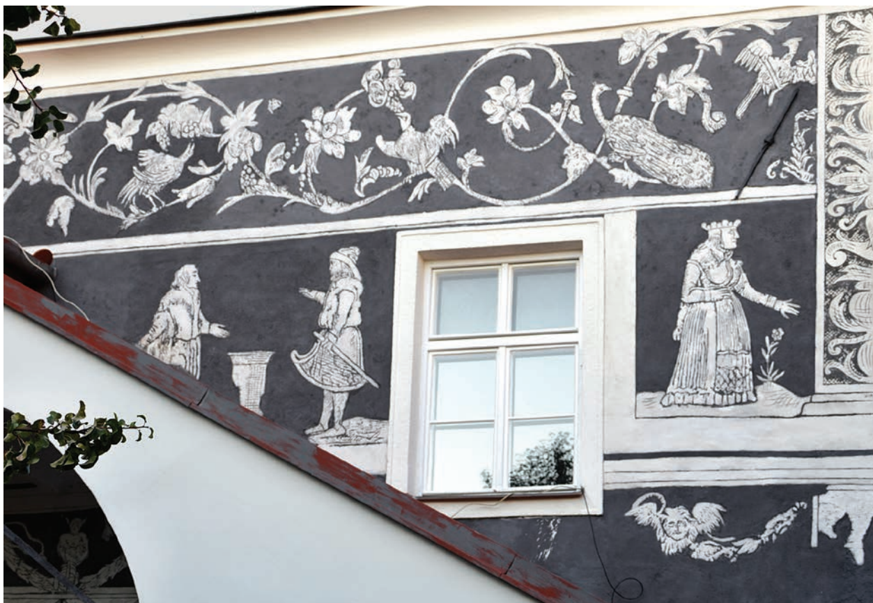
18 – Mikulov, Náměstí, dům čp. 24, jižní fasáda