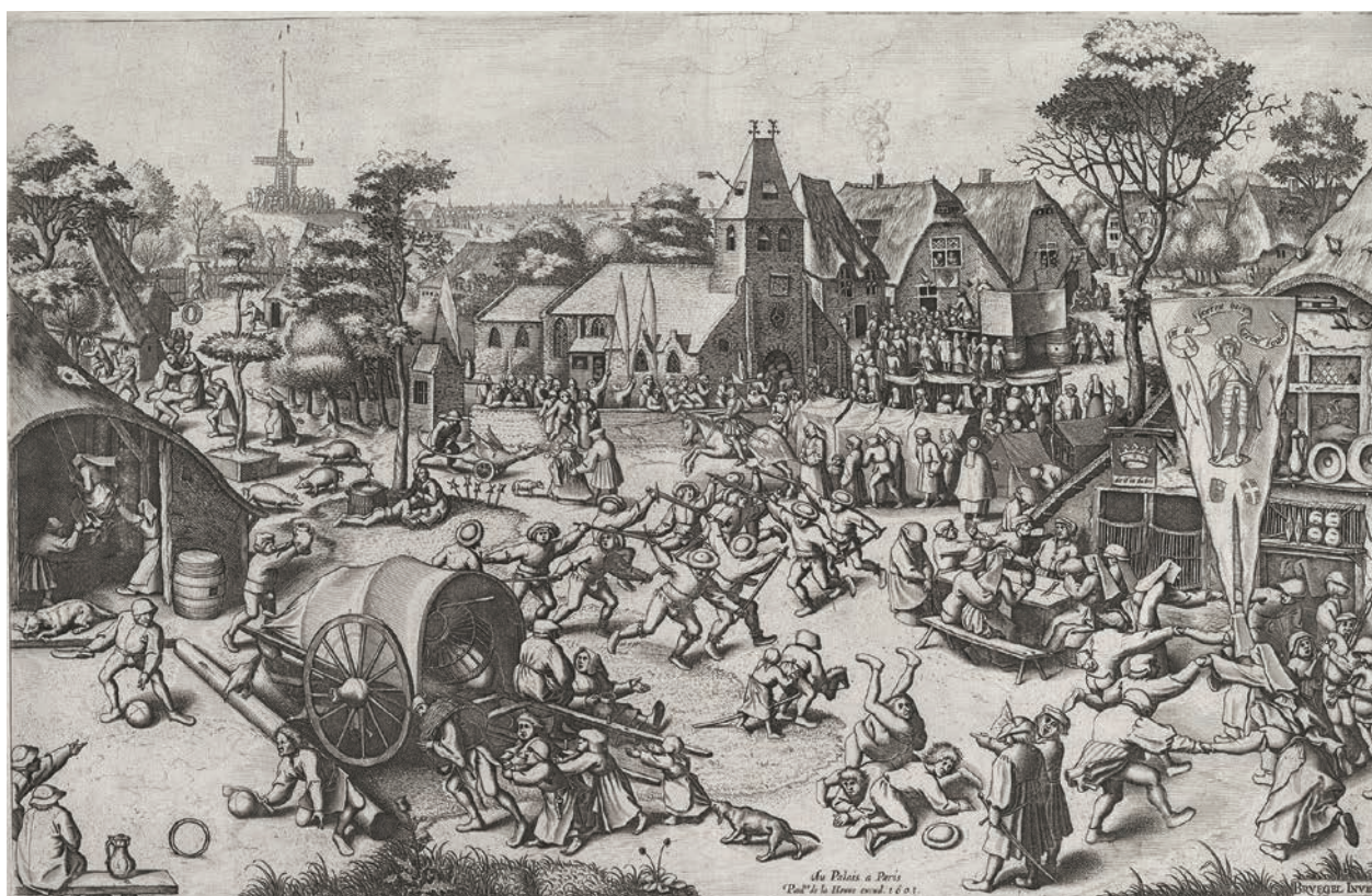
7 – Johannes van Doetecum podle Pietera Bruegela st., Posvícení sv. Jiří , mědiryt, 60. léta 16. století. New York, The Metropolitan Museum of Art

fragmentárně dochovaný pás severní fasády Malovaného domu v Mikulově. Kresbu Theodora de Bry doprovází latinský hanlivý nápis opovrhující žoldáky, ničícími města a krajinu. Obrazový jazyk radikálnějšího křídla reformace se grafickými listy s lancknechty vyjadřoval většinou k událostem německé selské války (ostatně ve vazbě na tento konflikt se výrazněji šíří i „sedlácká satira“). Od poloviny dvacátých let 15. století realizoval série lancknechtů právě Hans Sebald Beham. V polovině třicátých let vydali série se stejnou tematikou Erhard Schön a Niklas Stöer. 35