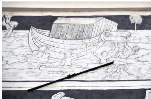
16 – Noemova archa, detail scény Potopa světa, sgrafito. Mikulov, Náměstí, dům č. 24, východní fasáda, sgrafitový pás nad okny prvního patra