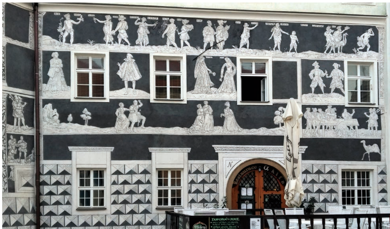
5 – Mikulov, Náměstí, dům čp. 24, severní fasáda

Od Theodora de Bry existuje i kresba kopírující motiv karavany smrti od Erharda Schöna, soupevníka Behamů. V průvodu lancknechtů se mimo jiné vyskytuje dro-medár. Hypoteticky tedy můžeme uvažovat o užití některých výřezů z této kompozice jako grafických předloh pro