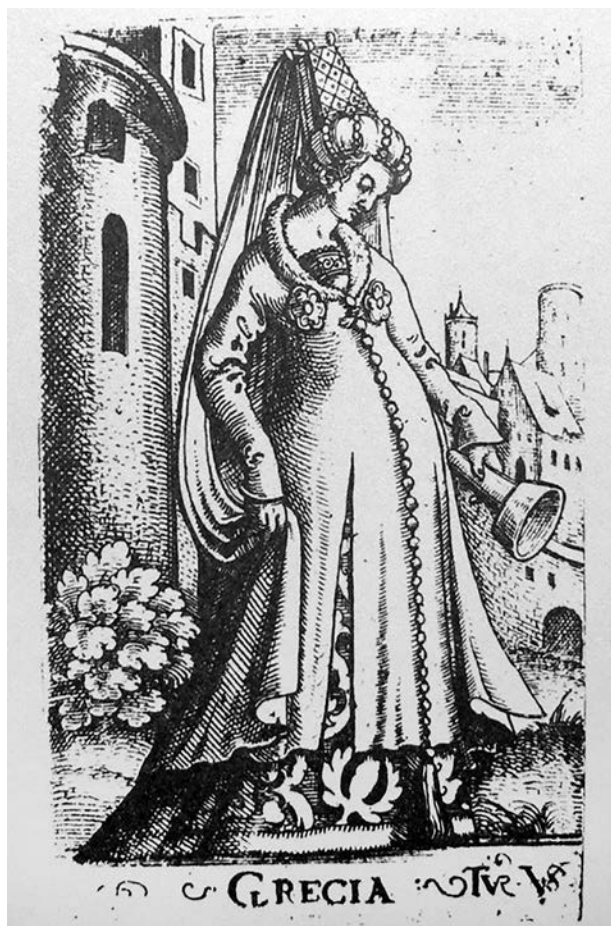
9 – Virgil Solis, Pošetilá panna – Grecia, dřevorez, před 1562

gorickém voze taženém čápy. 44 Konkrétně jde o alegorii staroegyptského boha plodnosti a úrody (zároveň smrti a znovuzrození – aspekt cyklické obnovy) Usira, diskutujícího s Triptolemem, prvním člověkem, jehož Deméter