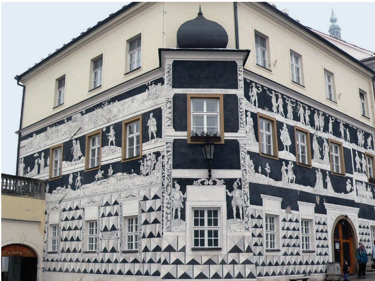
1 – Mikulov, Náměstí, dům čp. 24, severovýchodní nároží