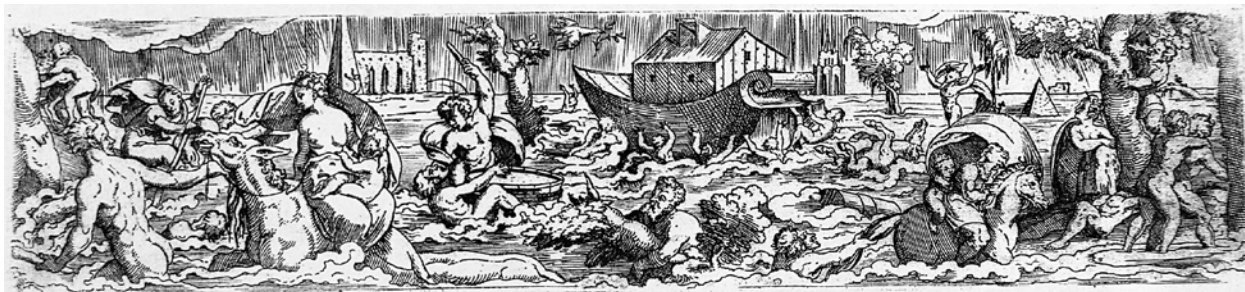
17 – Virgil Solis, Potopa světa , dřevoryt