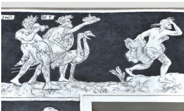
12 – Čelo průvodu bohyně Ceres a bakchantka, sgrafito. Mikulov, Náměstí, dům čp. 24, severní fasáda, pás pod korunní římsou