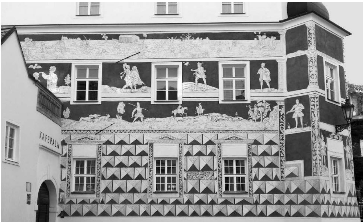
13 – Mikulov, Náměstí, dům č. 24, východní fasáda

Zabití Amazy Joabem z druhé knihy soudců v meziokenním páse v patře (napravo od Kristova křtu), lze vnímat v typologické souvztažnosti Davidova a Kristova života