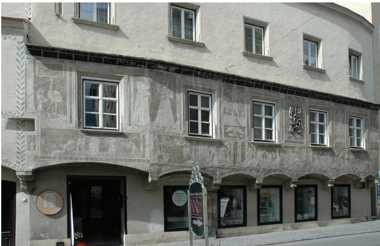
4 – Kremže, Kleines Sgraffitohaus, Untere Landstrasse Nr. 69, průčelí se sgrafitovou výzdobou, 1561