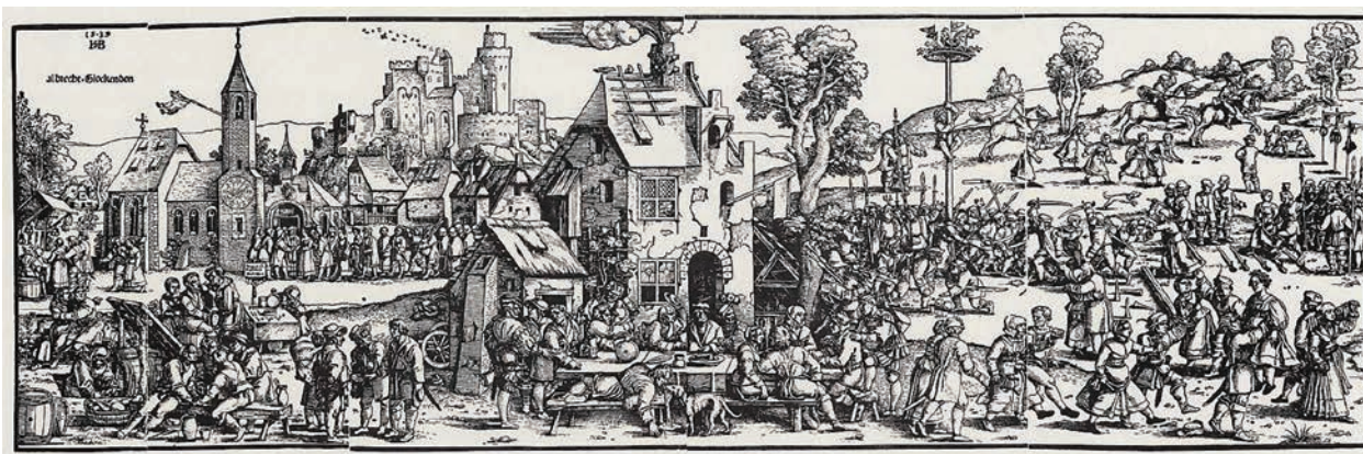
6 – Hans Sebald Beham, Velké posvícení , dřevorez, 1539. Berlín, Staatliche Museen Preußischer Kulturbesitz, Kupferstichkabinett