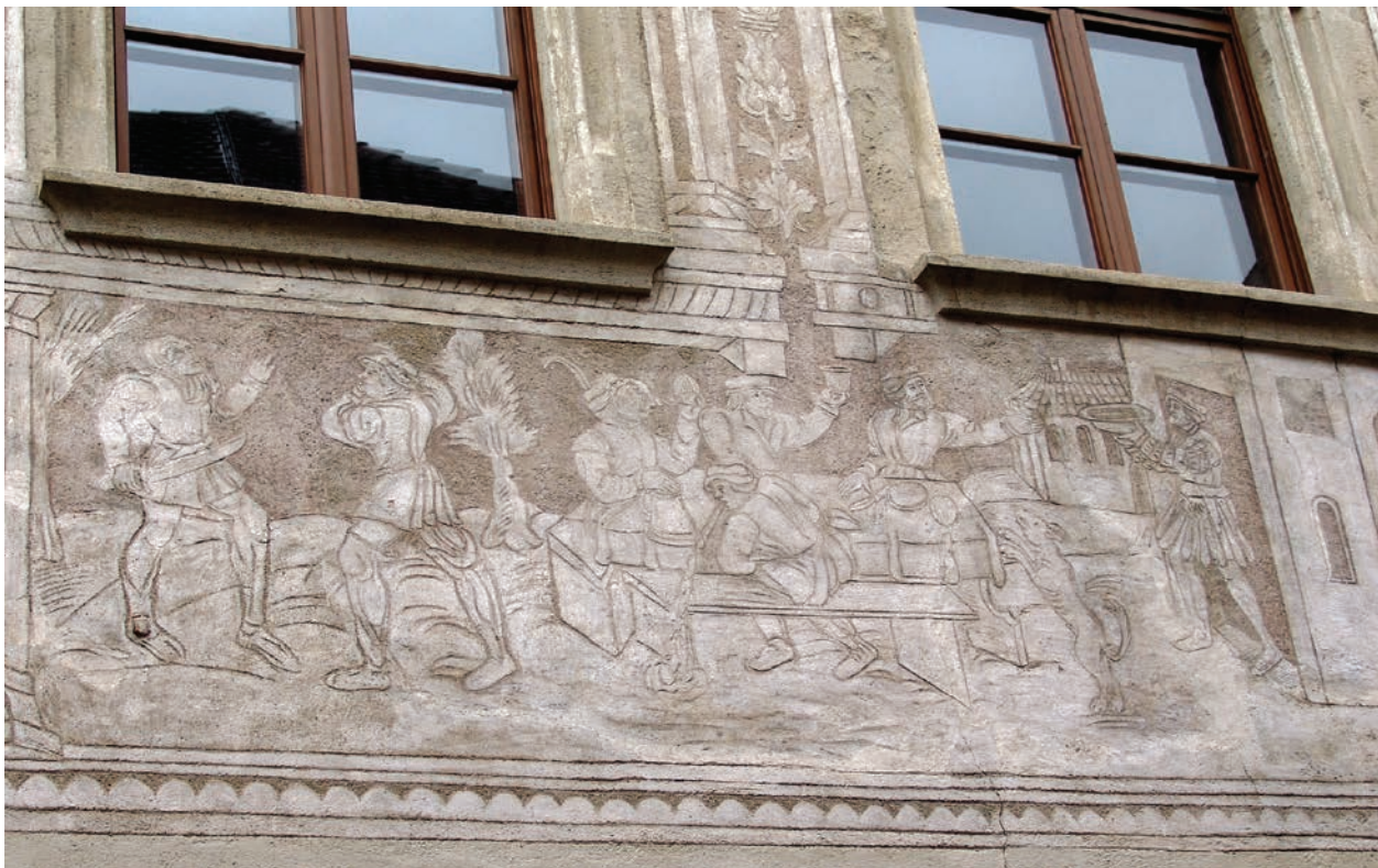
3 – Hodovní scéna, sgrafito, kolem roku 1561. Kremže, Grosses Sgraffitohaus, úsek fasády orientované do Margarettenstrasse