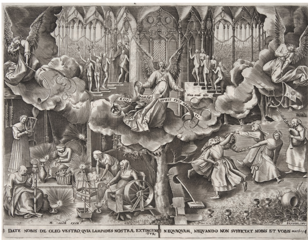
10 – Philips Galle podle Pietera Bruegela st., Podobenství o moudrých a pošetilých pannách , mědiryt, mezi 1560–1563. New York, The Metropolitan Museum of Art

Nárožní rizalit dekorují v čelní partii dva vojáci s halapartnami, kteří původně flankovali pravouhlé okno, a postavy hudebníků na bocích (loutnista, pištec, dudák a klečící muž žádající za ně o almužnu). Nad soklovou partii východní fasády probíhá po celé její délce vlys s loveckými výjevy (hon na lišku, hon na zajíce), v druhém pásu mezi okny jsou prezentovány zleva doprava obrazy Kristova křtu (Mt 3,13–17; Mk 1,9–11; Lk 3,21–22; J 1,29–34), zavraždění Amazy Joabem (2S 20,8–11), podobenství O rozsěvači (Mt 13,3–9; Mk 4,3–8; L 8,5–8) a krále Šalamouna zpívajícího Píseň písní , kterého na grafické předloze od Hanse Sebaldy Behama doprovází jedna z jeho manželek. Obraz je v Mikulově rozdělen, královnu můžeme spatřit na nádvoří fasádě. Dřevoryt je součástí série biblických ilustrací z roku 1534 (druhé vydání 1552). Série posloužila jako vodítko i pro pole s Amazou a Joabem a pro některé další obrazy nádvoří fasády (David a Jonatán, David a Goliáš?). 48