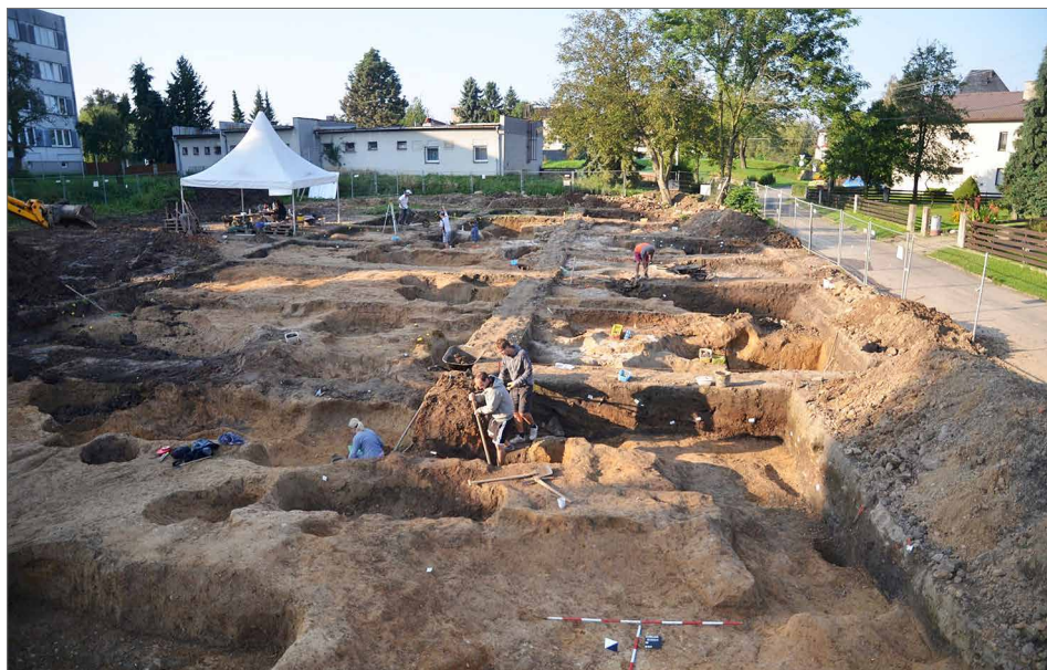
Obr. 9. Osoblaha. Záběr na výzkum Ústavu archeologie FPF Slezské univerzity v Opavě a společnosti Archaia Olomouc, o. p. s.