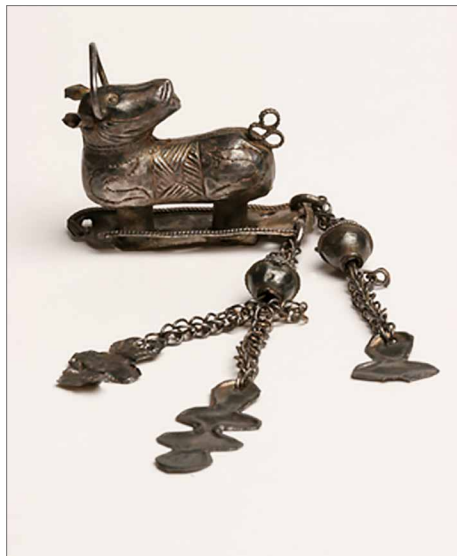
Obr. 6. Opava-Kylešovice. Stříbrná plastika beránka Božího. Podle Michnová–Polanský–Tomková–Tymonová 2010, 114. Abb. 6. Opava-Kylešovice. Silberplastik des Lamm Gottes. Nach Michnová–Polanský–Tomková–Tymonová 2010, 114.

Za podpory archeologického ústavu proběhly v letech 1952–1953 výzkumy hradisek na vrchu Landek v Ostravě-Koblově a v Chotěbuzi-Podoboře, které vedl Lumír Jisl († 1969), jehož příchod do opavského muzea v roce 1947 přinesl zásadní obrat v činnosti prehistorického oddělení (obr. 7). Poválečná situace tak jednoduchá nebyla, protože nálety na konci války poškodily muzejní budovu a zasáhly i archeologické sbírky. Proto se koncem května urychleně vrátil Karel Černohorský, ačkoli byl jmenován prozatímním ředitelem brněnského zemského muzea. Na doporučení akademiků Jana Eisnera, Jana Filipa a Jaroslava Böhma přijal studenta prehistorie