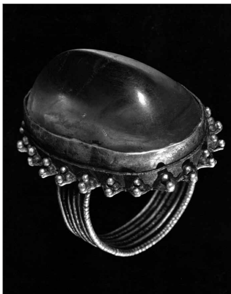
Obr. 1. Holasovice – Dvůr. Stříbrný prsten s křišťálem.

Zásluhou archiváře a středoškolského profesora Aloise Adamuse († 1964) vzniklo roce 1924 v Moravské Ostravě městské muzeum, do něhož byly převedeny sbírky ostatních muzeí včetně Bukovanského kolekce. Až do