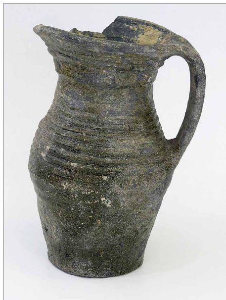
Obr. 8. Opava – dominikánský klášter. Zeleně polévaný džbán. Foto M. Tymonová.