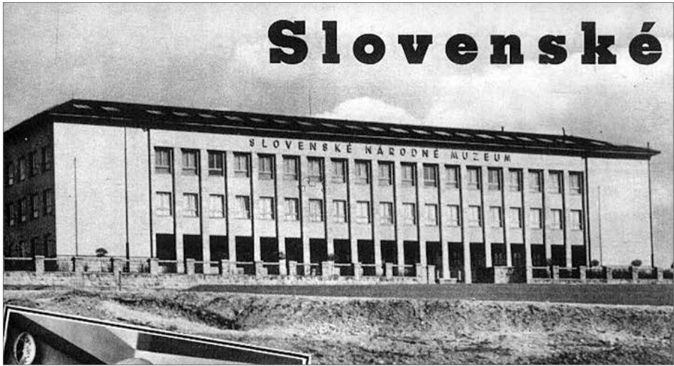
Obr. 2. Budova Slovenského národného múzea v Turčianskom Sv. Martine. V nej mal svoje sídlo aj Štátny archeologický ústav.