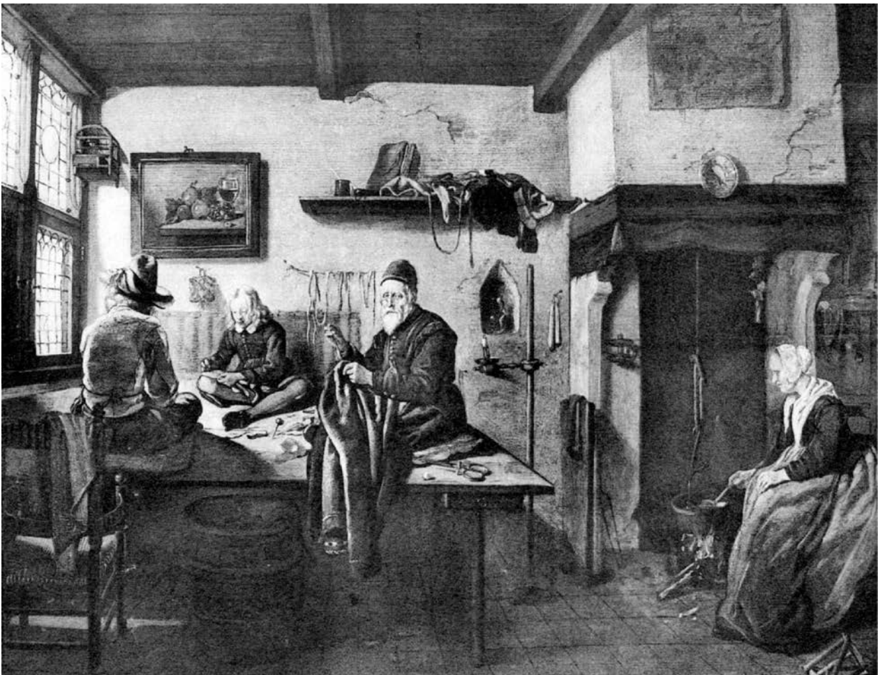
11 – Quiringh van Brekelenkam, Die Schneiderwerkstatt , 1655–1660. Vor 1929 Wien, Sammlung Maximilian Kellner, heute Montreal Museum of Fine Arts

Berlin 1905, S. 8, Kat. Nr. 12, Abb. Taf. 9 („ Kapitalbild des Meisters “); Otto von Schleinitz, Neuigkeiten von Kunstmarkte, Der Kunstmarkt II , 1904–1905, Nr. 26, 31. 3., S. 149 (Brekelenkam, „ Das echte, aber nicht gerade reizvolle, auch nicht tadellos erhaltene Stück wurde übermässig hoch getrieben “); Aukt. Kat. Lepke 1929, S. 2, 10, Kat. Nr. 3, Abb. Taf. 3 (Quiryng Brekelenkam); Belvedere 1929, S. 389; Scharf 1929, S. 659; Kunstauktion 1929a, S. 2; Kunstauktion 1929b, S. 4; Kustauktion 1929c, S. 21; HdG, Exzerpten, Kart. 58, Nr. 1087025 (Quiringh van Brekelenkam, nach der Abbildung echt); Seymour Slive, in: European Paintings in the Collection of the Worcester Art Museum , Worcester 1974, S. 89, Anm. 2; MacLaren – Brown 1991, S. 58; Angelika Lasius, Die Schuhmacher- und Schneiderdarstellungen des niederländischen Malers Quiringh Gerritsz. Van Brekelenkam , Wallraf-Richartz-Jahrbuch 50, 1989, S. 160, Anm. 48 (unsprünglich von Quiringh van Brekelenkam, später übermalt); Angelika Lasius, Quiringh van Brekelenkam (Ars picturae; 3), Doornspijk