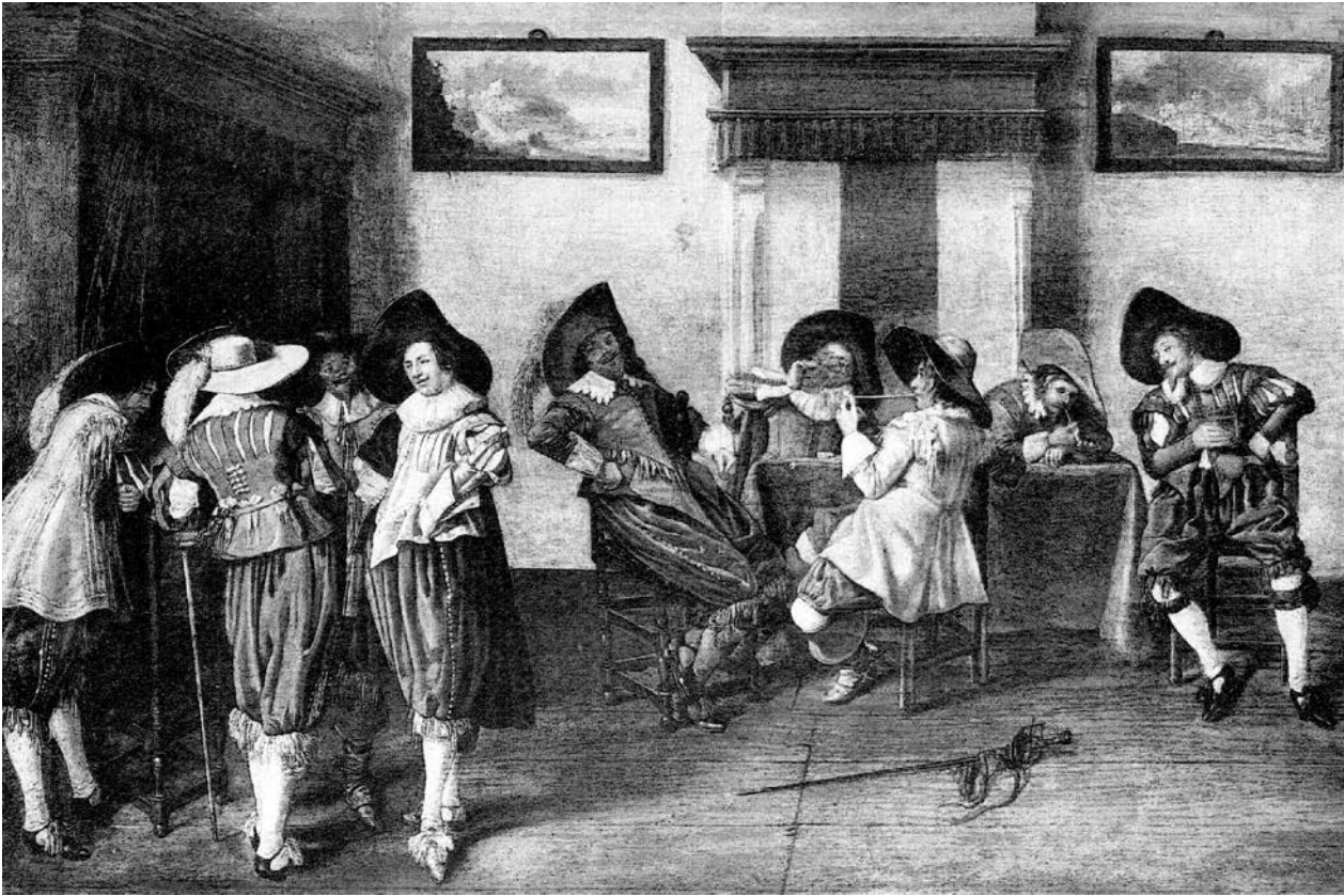
14 – Dirck Hals, Tabakskollegium . Vor 1929 Wien, Sammlung Maximilian Kellner, heutiger Verbleib unbekannt (1995, Paris, Versteigerung Etude Tajan)

Aanwinsten 1940–1946. Tentoonstelling van schilderijen, beeldhouwkunst, meubelen, kunstnijverheid, tekeningen en prenten, verworven in de jaren 1940–1946 , Amsterdam 1946, S. 13, Kat. Nr. 18; Pieter J. J. van Thiel – C[ornelius] J[ohannes] de Bruyn Kops [et al.], All the Paintings of the Rijksmuseum in Amsterdam. A completely illustrated Catalogue , Amsterdam 1979, S. 250, Abb.; Bernard Aikema – Ewoud Mijnlief – Bert Treffers (edd.), Italian Paintings from the Seventeenth and Eighteenth Centuries in Dutch Public Collections , Florence 1997, S. 79–80, Kat. Nr. 80 (Giacomo Guardi – Kopie).