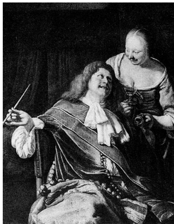
16 – Frans I. van Mieris – Kopie, Kavalier und Küchenmagd .

Original in London, The Queen's Gallery, Buckingham Palace (Inv. Nr. RCIN 404614, Eichenholz, 21,2 × 17,4 cm; siehe Naumann 1981, S. 53, Kat. Nr. 45, Abb.).