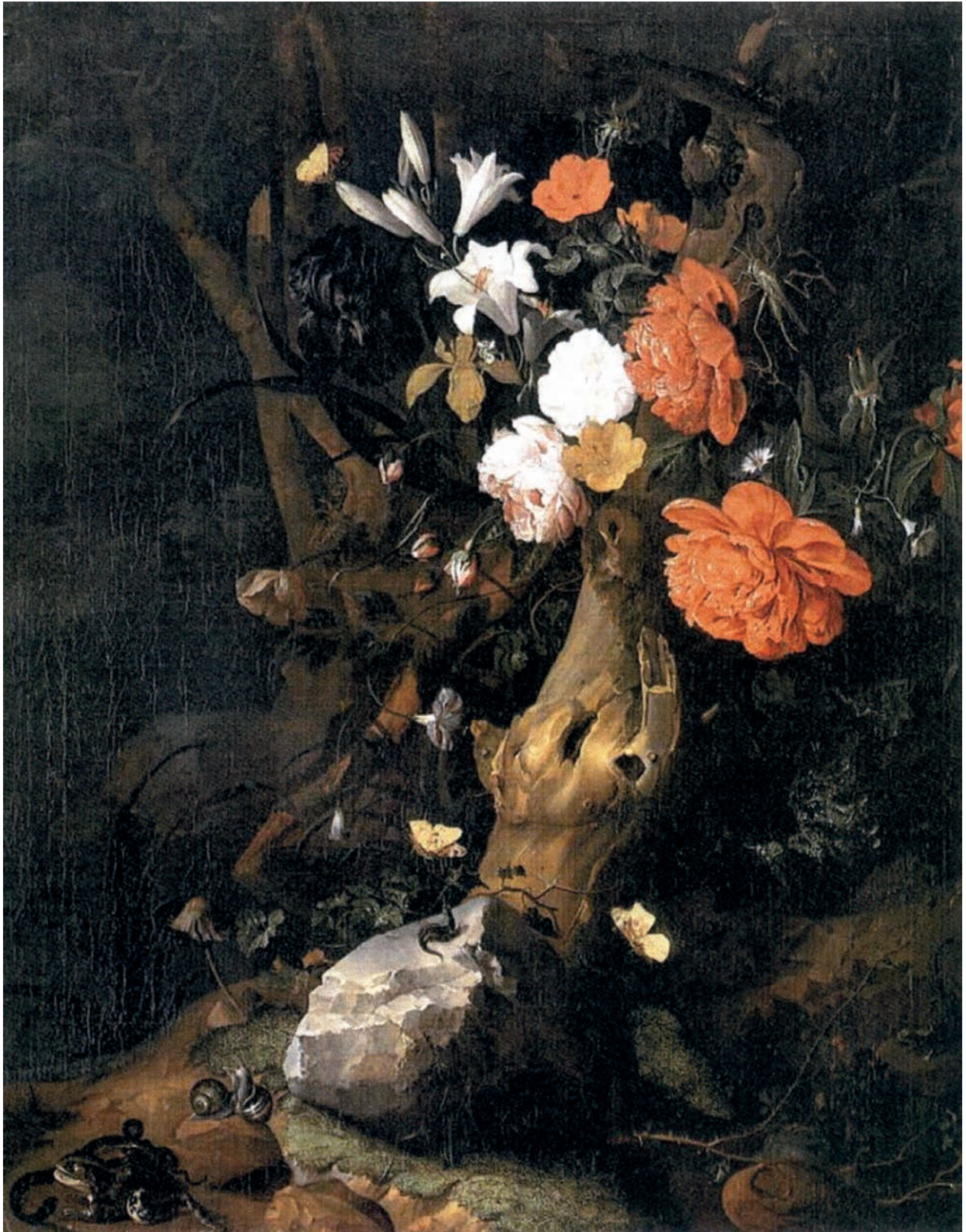
18 – Rachel Ruysch, Waldstilleben mit Blumen , 1686. Vor 1929 Wien, Sammlung Maximilian Kellner, heute Rochester, New York, USA, The Memorial Art Gallery, University of Rochester