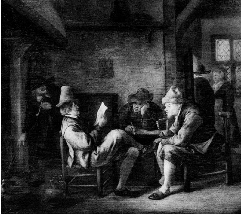
9 – Jan Steen, Der Vorleser in der Dorfschenke . Vor 1929 Wien, Sammlung Maximilian Kellner, heutiger Verbleib unbekannt

Literatur: Gemälde alter Meister des 15. Bis 18. Jahrhunderts aus französischen Besitz . Rudolph Lepke, Berlin 1910, S. 14, Kat. Nr. 86, Abb. Taf. 14; Radio-Wien 5, 1928, Nr. 1, Bilderbeilage, Abb. S. 1/V; Aukt. Kat. Lepke 1929, S. 9, Kat. Nr. 1, Abb. Taf. 1 (Gerhard Terborch); Belvedere 1929, S. 388; Scharf 1929, S. 659, Abb.; Kunstauktion 1929a, S. 2; Kunstauktion 1929a, S. 2; Kunstauktion 1929b, S. 4; Deusch 1929, S. 21; Deusch 1930, Abb. S. 84; Neue Freie Presse 1929, S. 7; HdG, Exzerpten, Kart. 49, Nr. 1066953, 1067091 (Gerard ter Borch, nach der Abbildung echt); Catalogue Goudstikker 1930, Kat. Nr. 58, Abb.; Bernt 1940, S. 42, Kat. Nr. 186, Abb. Taf. 60; Weltkunst XIV, 1940, Nr. 52, 22. 12., S. 2; Gudlaugsson 1960, S. 246, Kat. Nr. B 3 (Werkstatt- und Schülerarbeit); Rijksdienst Beeldende Kunst. Old Master Paintings. An Illustrated Summary Catalogue , Zwolle – Den Haag 1992, S. 50, Kat. Nr. 275, Abb. (Gerard ter Borch – Nachfolger); Old Master Paintings from the Collection of Jacques Goudstikker , Christie's, Amsterdam, 2007, Kat. Nr. 27 (des Gerard Terborch – Werkstatt).