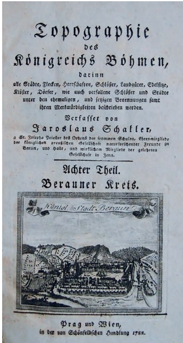
Obr. 3: Titulní list 8. dílu Schallerovy Topografie – Berauner Kreis (Schaller, J.: Topographie 8.)