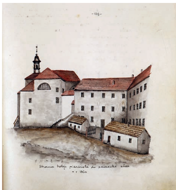
Obr. 5: Budova piaristické koleje v Benešově od západu z ulice Zámecká (dnes Tyršova). Kresba Antonína Pinkase. (Muzeum Podblanicka, p. o., Antonín Pinkas, Rukopis topografie Benešova a okolí, svazek 2 – Benešov – Velké a Malé náměstí, s. 129; foto Marta Crhánková)

(zdroj: https://commons.wikimedia.org/wiki/File:Nostic%C5%AFv_pal%C3%A1c_17.JPG )