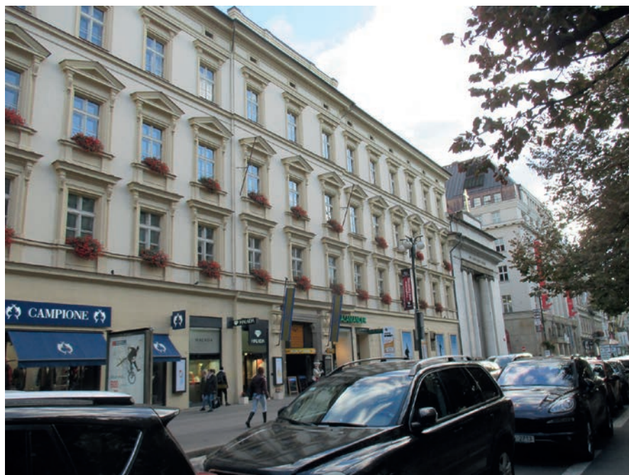
Obr. 1: Budova bývalé piaristické koleje v Praze Na Příkopech