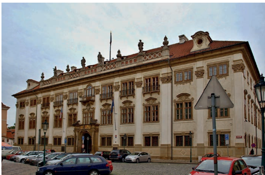
Obr. 4: Nosticovský palác v Praze na Malé Straně

(zdroj: https://commons.wikimedia.org/wiki/File:Nostic%C5%AFv_pal%C3%A1c_17.JPG )