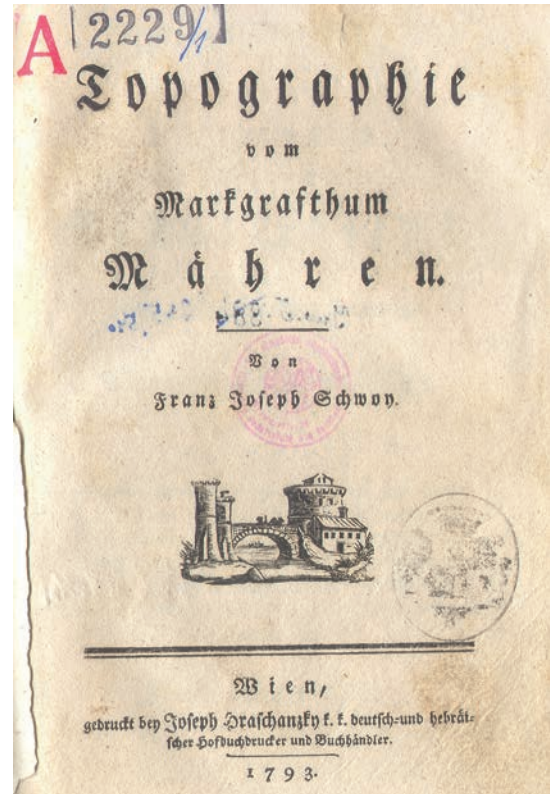
Obr. 7: Titulní list topografického díla Františka Josefa Schwoye Topographie vom Markgrafthum Mähren z roku 1793