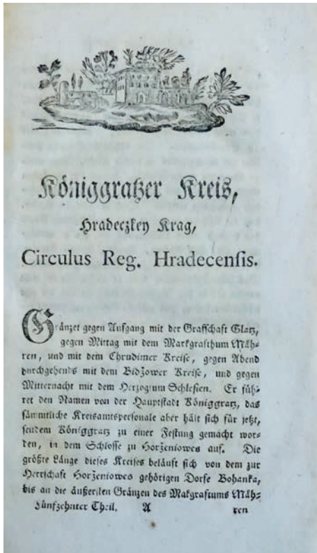
Obr. 6: Popis Královéhradeckého kraje v díle Jaroslava Schallera Topographie des Königreichs Böhmen, Bd. 15, Königgräzer Kreis z roku 1790 (Historický ústav AV ČR)