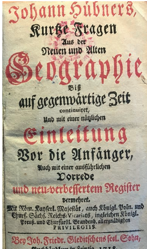
Obr. 4: Titulní list geografického díla Johanna Hübnera Kurtze Fragen aus der Neuen und Alten Geographie ve vydání z roku 1718