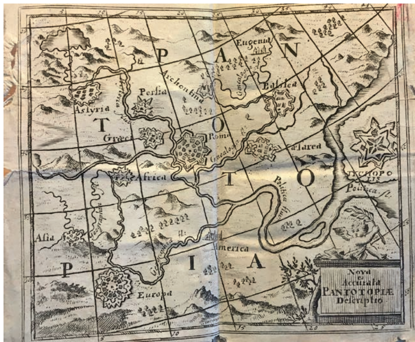
Obr. 5: Nova et Accurata Pantotopiae Descriptio, mapa z geografického díla Johanna Hübnera Kurtze Fragen aus der Neuen und Alten Geographie ve vydání z roku 1718 (Historický ústav AV ČR)