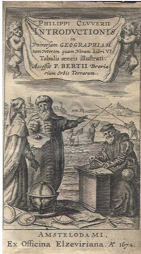
Obr. 2: Titulní list geografického díla Filipa Clüvera Philippi Cluverii Introductionis in universam geographiam ve vydání z roku 1672