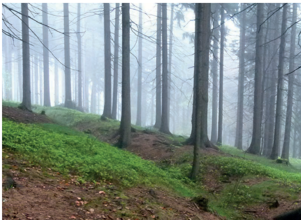
Obr. 5: Jeden z přirozeně zanikajících úvozů v zalesněném JV svahu Dalešického vrchu (okr. Jablonec nad Nisou).