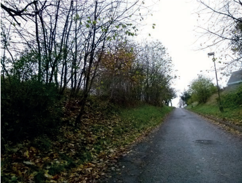
Obr. 2: Turnov-Vrchůra (okr. Semily): pozůstatek hluboce zaříznutého úvozu kdysi významné cesty, která spojovala města Turnov a Jičín. V moderní době byl její povrch zpevněn a dodnes je využívána jako lokální komunikace.