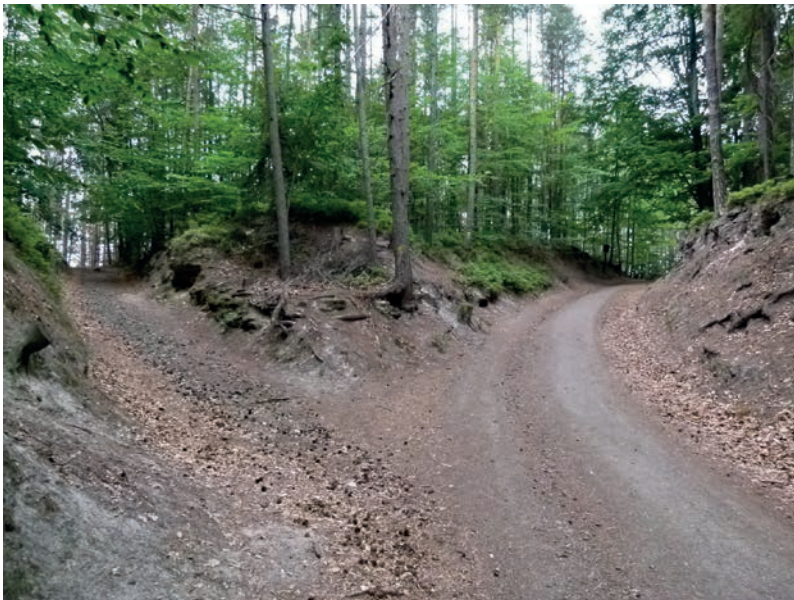
Obr. 3: Úvozové rozcestí v jedné z turisticky nejfrekventovanějších lokalit Českého ráje – Hruboskalsku nad polykulturním archeologickým nalezištěm Čertova ruka. Tyto cesty, které využívají vysokých suchých skalních hřebenů, svému účelu nepochybně sloužily již v pravěku a i v dnešní době jimi projdou tisíce turistů ročně.