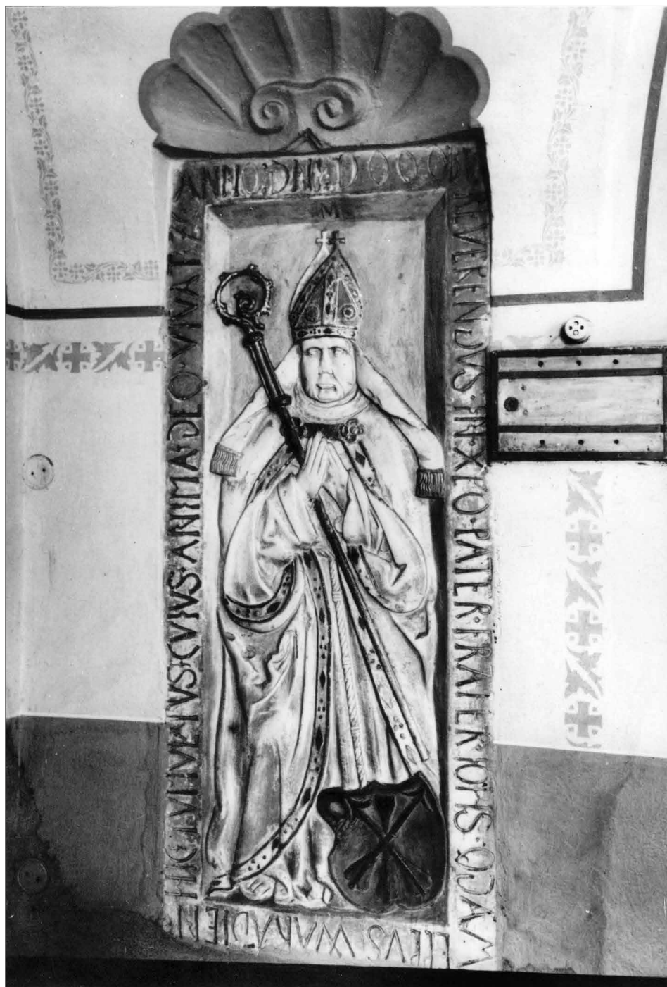
Obr. 16. Náhrobník Jana Filipce v sakristii františkánského kostela Zvěstování Panny Marie v Uherském Hradišti.