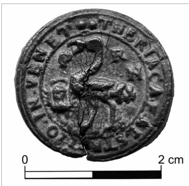
Obr. 2. Uzávěr od theriaků z lékárny U Zlatého pštrosa s volně umístěnými písmeny P R N. Soukromá sbírka.

Oba uzávěry pocházejí z proslulé lékárny U Zlatého pštrosa (Al Struzzo D'oro), která sídlila nedaleko mostu Ponte dei Bareteri. Benátský lékař a spisovatel Orazio Guarguanti ve svém pojednání o theriaků a jeho účincích v roce 1596 zmiňuje, že jeden z nejlepších se vyrábí právě v lékárně U Zlatého pštrosa (Palmer 1985, 108). Obraz pštrosa držícího v zobáku podkovku můžeme vidět i na uzávěrech, nalevo od pštrosa symbolizuje benátský původ lev sv. Marka a mimo opis jsou volně umístěná písmena P R. Ta by mohla být iniciálami jednoho z nejznámějších majitelů této lékárny Paola Romaniho. Paolo Romani (též Paoli di Romani) převzal vedení lékárny U Zlatého pštrosa v roce 1585 po smrti svého předchůdce Georga Melicha (Giorgio Melichio). Po Romanim lékárnou zdědil jeho zeť Alberto Stecchini, a to nejpozději v roce 1605 (Palmer 1985, 117). Pokud tedy písmena P R skutečně znamenají iniciály Paola Romaniho, je možno takto označené uzávěry datovat do období po roce 1585. Uzávěry s vyobrazením pštrosa jsou mezi nálezky poměrně časté a existují v řadě variant, například varianty bez volně umístěných písmen, případně s označením DO RO či P R N (obr. 2).