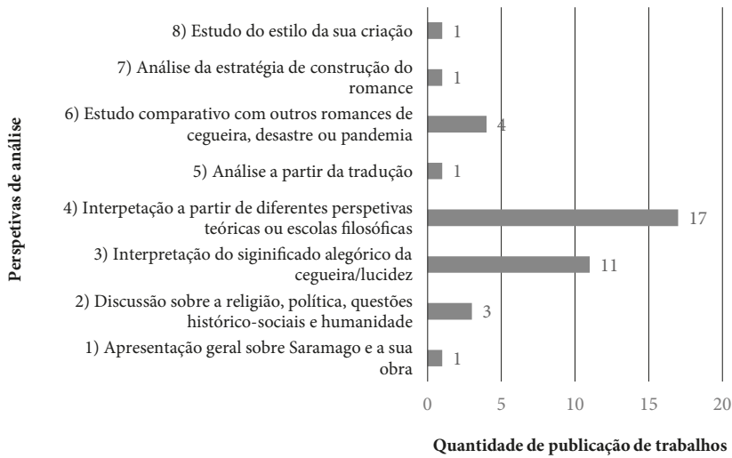
Tabela 4: Perspetivas de análise acerca de Saramago na China

a transformação social, considerou que “a literatura não transformou nem transforma socialmente o mundo” 18 , “apesar da excelência de pensamento e fortuna de beleza” 19 que nos deixou.