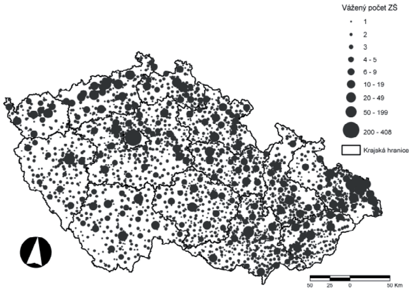
Obr. 1: Vážený počet základních škol v obcích Česka k roku 2004