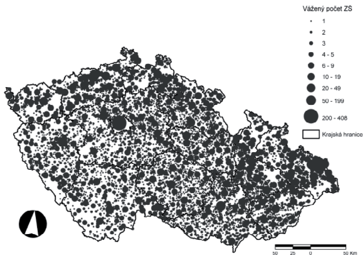
Obr. 2: Počet základních škol v obcích Česka k roku 1961