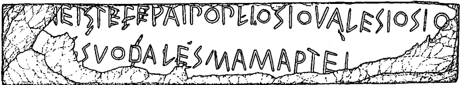
Fig. 4. L'iscrizione da Satricum: Lapis Satricanus

7. (CP) Laminetta bronzea con dedica ai Dioscuri da Lavinium, ductus sinistrorso, un segno circolare di interpunzione, datazione seconda metà del VI sec.