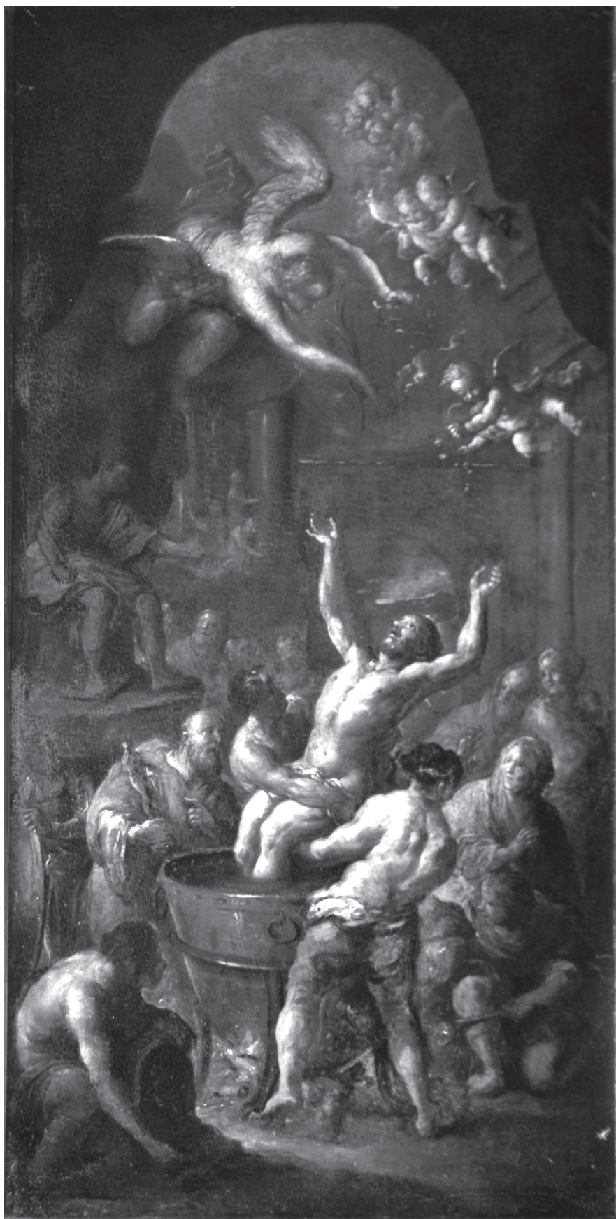
1 – Franz Xaver Wagenschön, Mučení sv. Jana Evangelisty před Porta Latina v Římě, skica, olej, plátno, 1766. Státní zámek Sychrov, inv. č. 8762