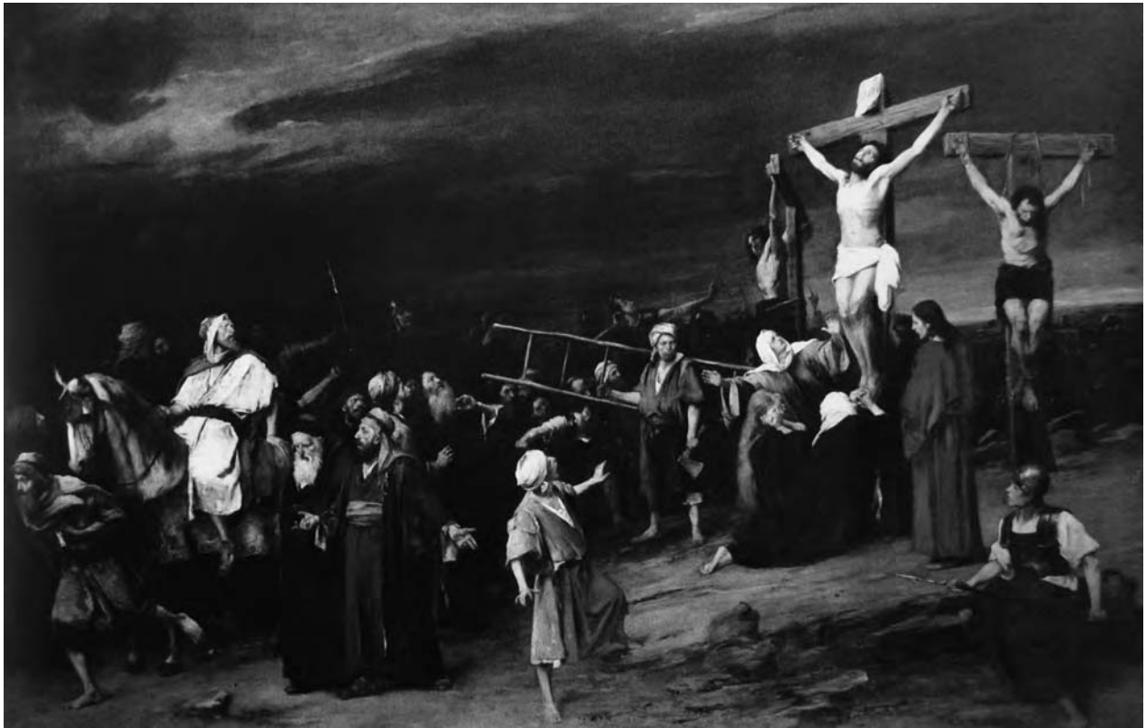
5 – Mihály Munkácsy, Golgota , 1884. Soukromá sbírka

laroche (1797–1856), který ji využíval k atraktivní prezentaci svých historických pláten. Delaroche byl geniální marketingový stratég, který v době neexistence filmu dokázal výstavou uměleckého díla vytvořit masovou zábavu předjímající filmová představení. Z Delarochovy metody se stal běžný prostředek prezentace monumentálních obrazů, který v osmdesátých letech zažíval svou závěrečnou fázi. Munkácsy byl umělcem, který i v této době dokázal zaujmout zmlsané publikum. Nespokojil se se statickým umístěním obrazu do haly, kudy proudila řada návštěvníků, ale obraz nainstaloval do temné místnosti ozářené důmyslně rozestavěnými lampami. Shromážděnému publiku prostřednictvím spouštěného závěsu postupně odhaloval kompozici, která ve svitu lamp vytvářela ještě sugestivnější efekt. 11