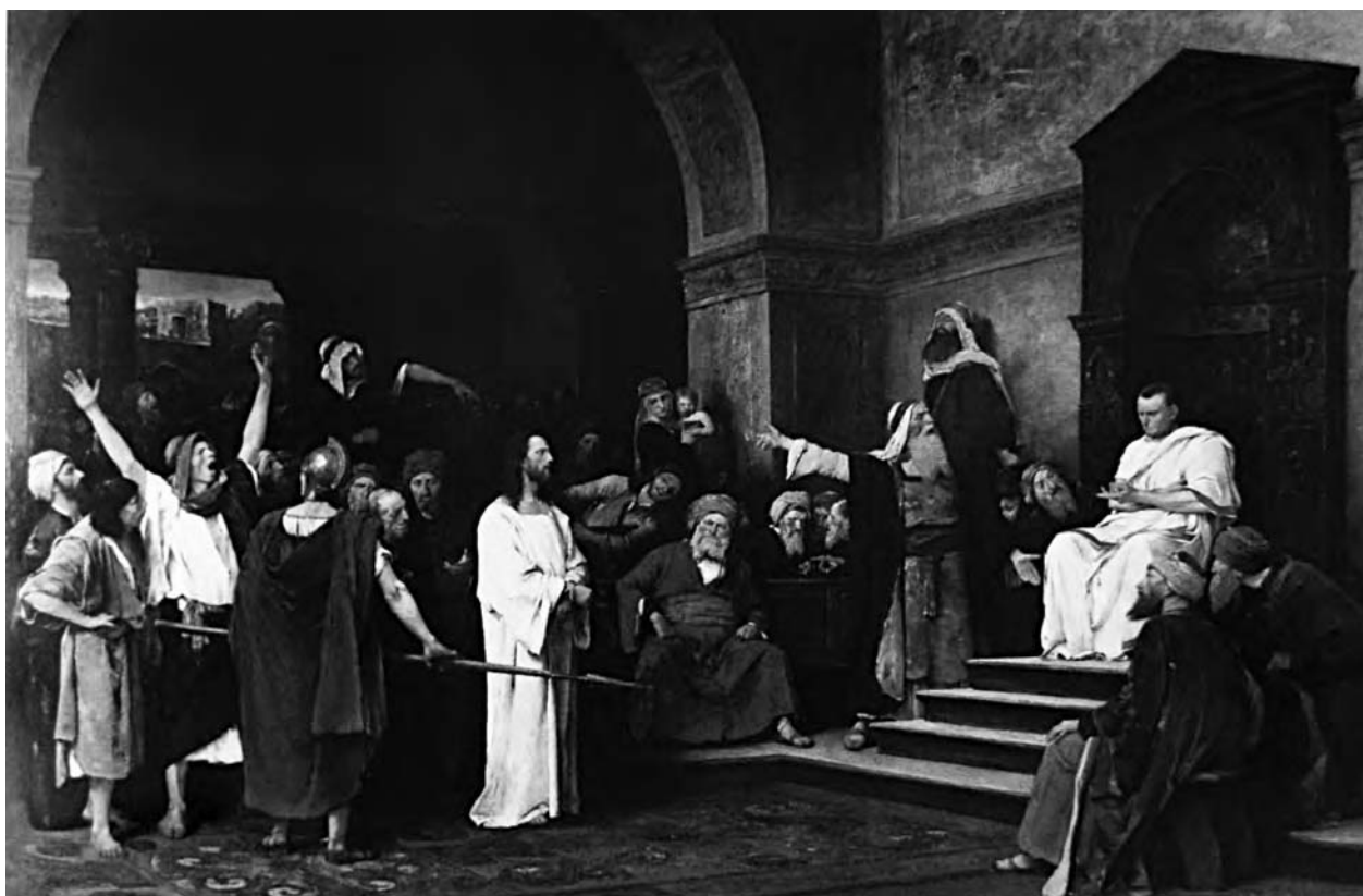
4 – Mihály Munkácsy, Kristus před Pilátem , 1881. Ontario, Kanada, Art Gallery of Hamilton

přístupem k aktualizaci biblických dějů. Bezprostřednost zachycení biblické události byla dosahována spíše než zasažením do současnosti věrnou rekonstrukcí reálií biblické epochy. Pokročilé archeologické a historické výzkumy v oblasti Izraele v druhé polovině 19. století přinášely konkrétní představu o oděvech, architektuře a životním stylu v Izraeli za dob Kristova působení. Malíři využívající těchto znalostí mohli opustit konvenční anachronické zobrazování biblických postav a přiblížit je více skutečnosti.