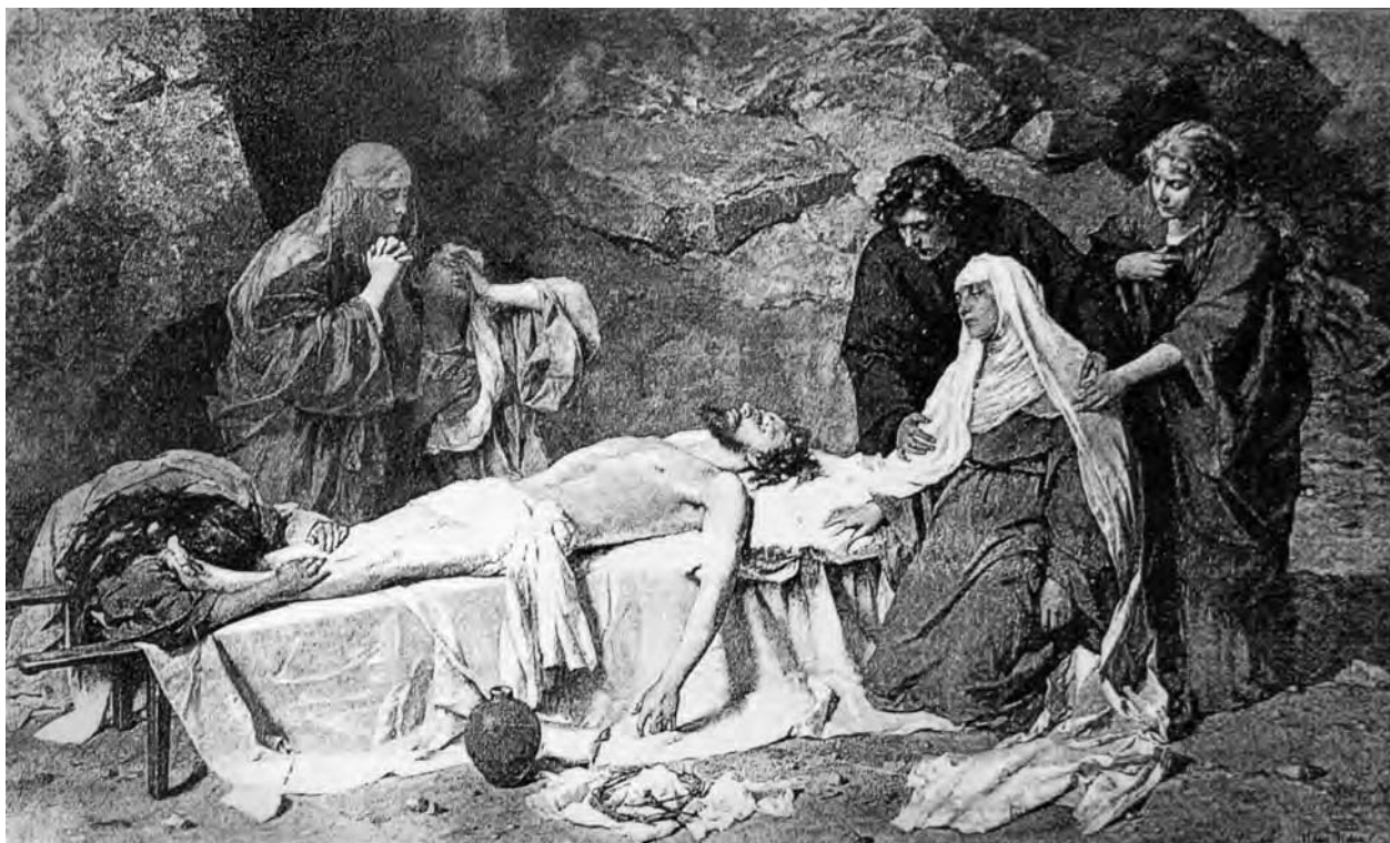
1 – Hans Tichy, Pieta (původní stav), 1888. Moravská galerie v Brně

ní rozdíl proti oltářním obrazům v brněnských barokních kostelech.