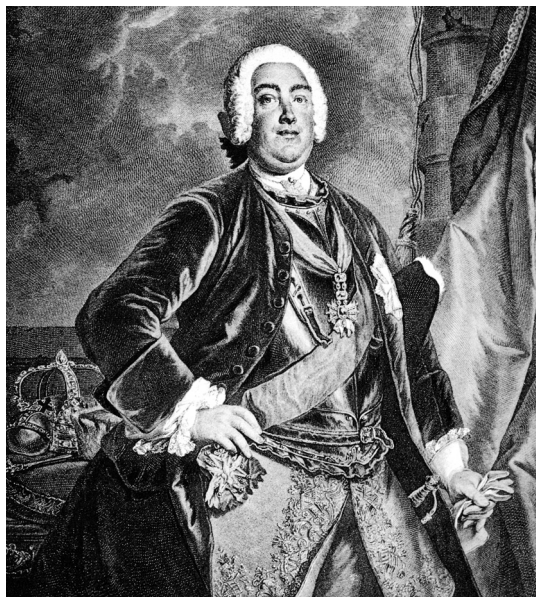
17 • Friedrich August II., kurfiřt saský, později (jako August III.) také král polský. Rytina G. F. Schmidta podle portrétu, jehož autorem je L. de Silvestre (1743). Jeho syn Friedrich Christian je předmětem Vivaldiho obdivu.