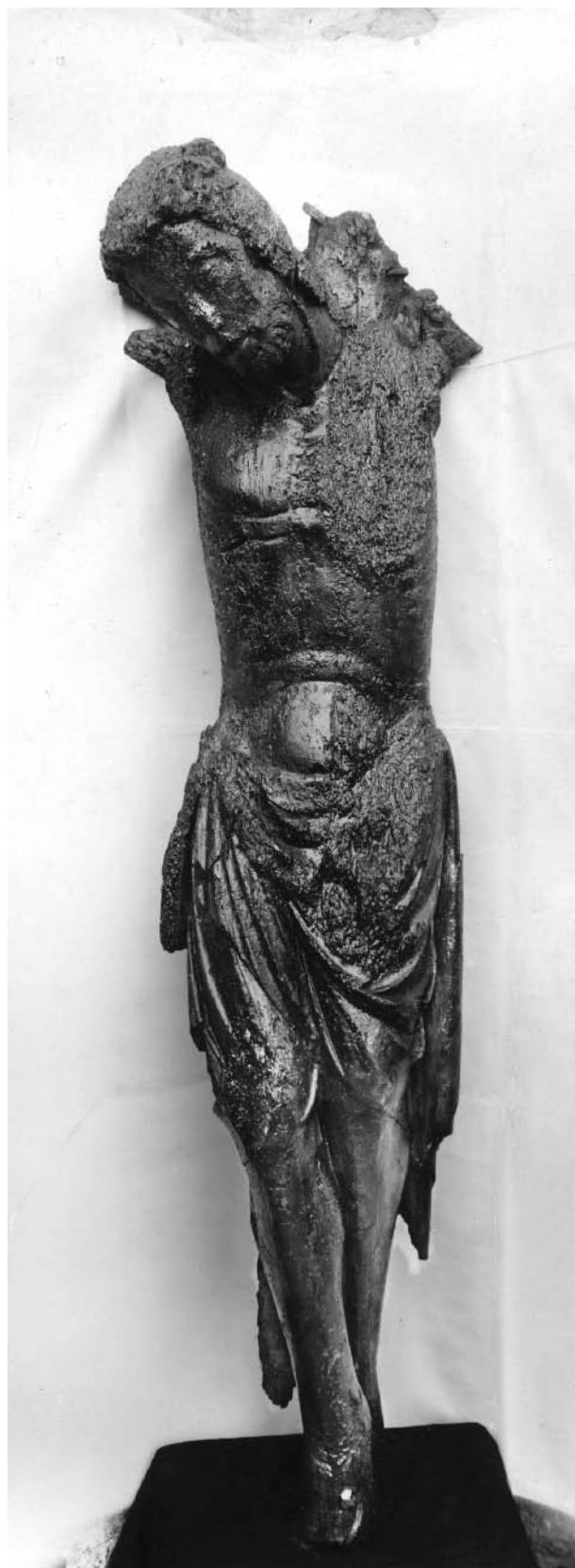
1 – Ukřižovaný – stav před rokem 1970, 3. třetina 13. století. Polná, Městské muzeum