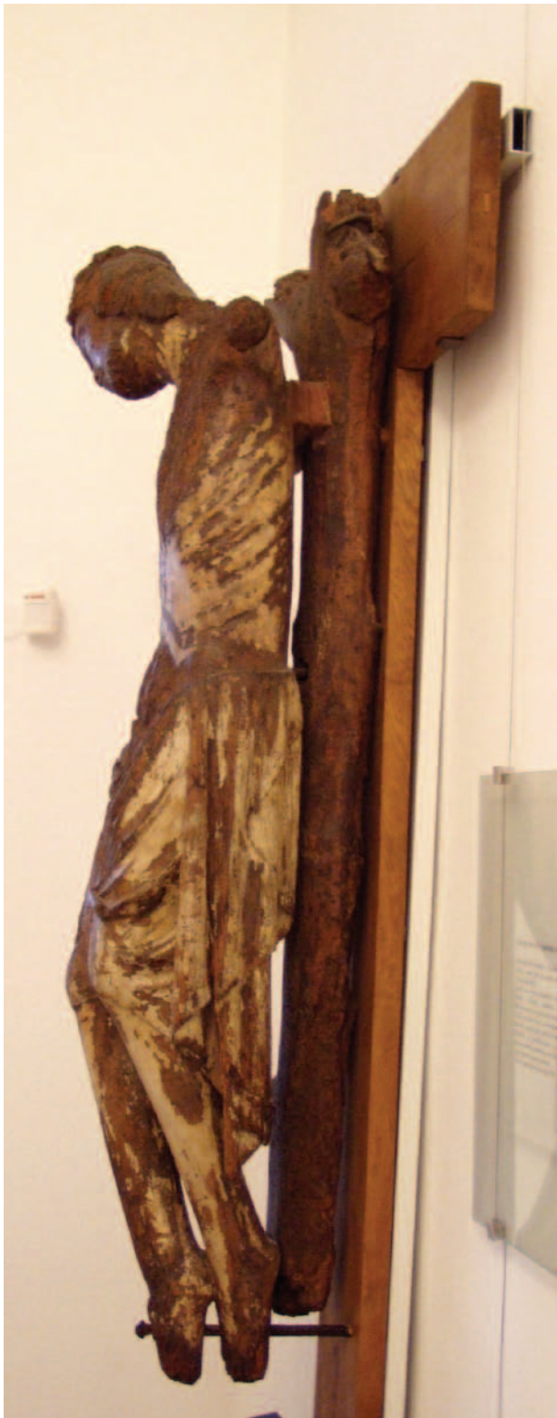
2 – Ukřižovaný – pohled zleva, 3. třetina 13. století. Polná, Městské muzeum

ské muzeum. 15 Vzhledem k nepříznivému stavu sochy neváhal provést amatérský restaurátorský zákrok. Sochu položil do kádě užívané obvykle při zabíjačce, kde ji zalil nějakým druhem laku (možná šelakem). Představu o výsledku zmíněného zásahu máme díky sérii fotografií uložených v archivu Semináře dějin umění FF MU, které pořídil Albert Kutal. [obr. 1]