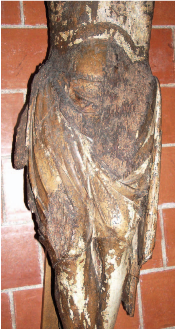
3 – Ukřižovaný – detail bederní roušky, 3. třetina 13. století. Polná, Městské muzeum

chovaných děl, tak vzhledem k torzálnímu zachování polenské řezby. Pokud přijmeme tezi Roberta Suckaleho 24 za pravdivou, nezbyvá než datovat polenský krucifix pomocí formální analýzy nejpozději do třetí třetiny 13. století. Tuto hypotézu můžeme velmi dobře podpořit historickou situací Polné ve 13. století.