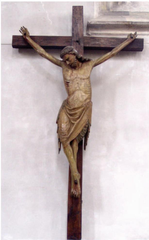
4 – Ukřižovaný, 4. čtvrtina 13. století. Brno, kostel sv. Jakuba

Úvahy o původním umístění polenského Ukřižovaného musíme začít ve farním kostele Panny Marie. Původní středověká stavba dnes již nestojí, přesto můžeme její podobu rekonstruovat na základě veduty Jorise Hoefnagela z roku 1618. Chrám byl pravděpodobně prostornou trojlodní bazilikou – chybějící archeologický průzkum kostela však znesnadňuje datování stavby na vedutě. Pokud byl kostel v Polné již k roku 1242, musela to být spíše románská stavba, která byla upravována v pozdějších desetiletích. V kostele však nepochybně zobrazení Ukřižovaného Krista existovalo, a pokud předpokládáme, že zkoumané torzo bylo skutečně vytvořeno pro tento kostel, tak je téměř jisté, že bylo umístěno na příčném břevně oddělující hlavní loď od presbytáře, a to i kvůli již řečeným kvalitám sochy pozorovatelných z mírného podhledu. Pro Ukřižované zachovalé na příčném břevně dosud je navíc typické opracování ze všech stran, což je charakteristika, která platí i pro polenské torzo.