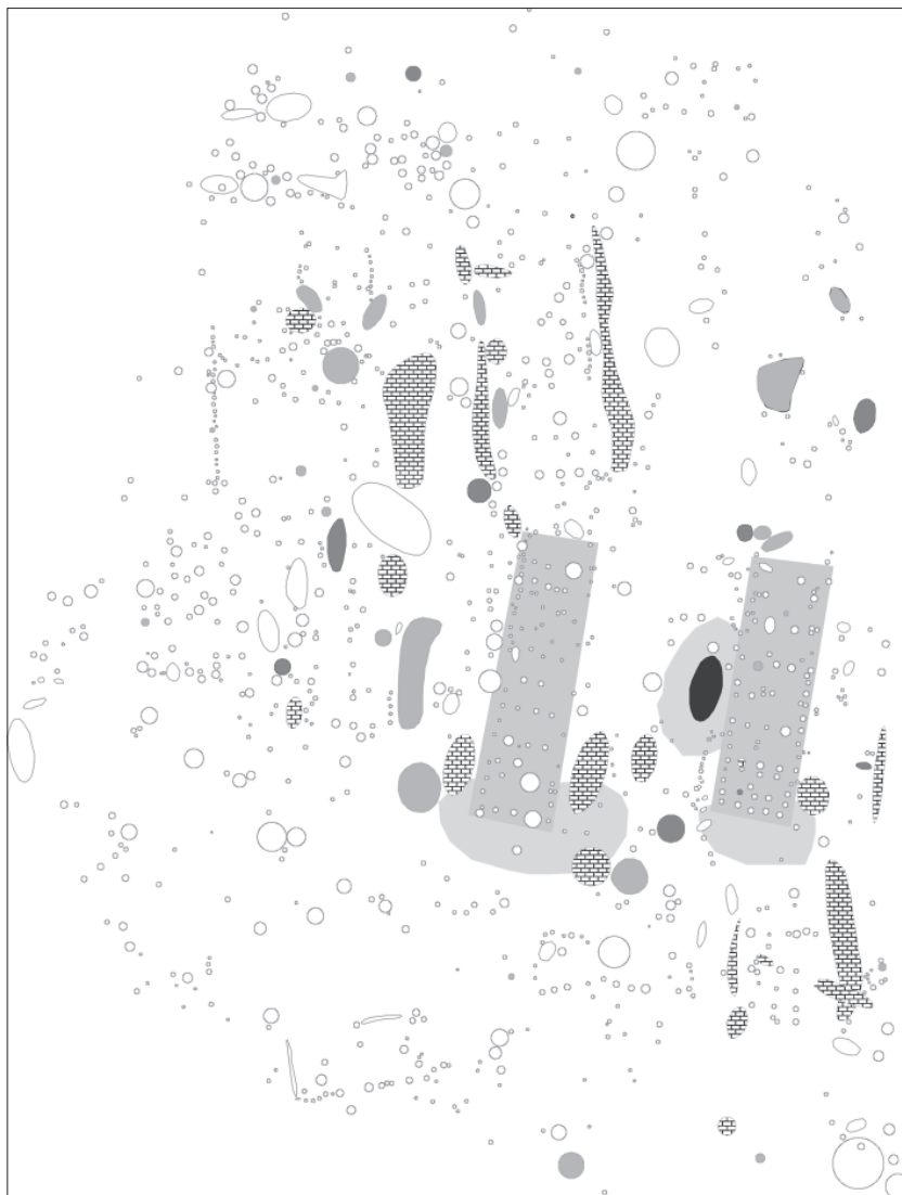
Obr. 27. Turnov – Maškovy zahrady. Objekt 753 ve vztahu k dlouhým domům. Legenda: šedě zvýrazněné objekty – objekty LnK bez industrie, tmavě šedě zvýrazněné objekty – objekty LnK s industrií, černě – objekt 753, rastrem zvýrazněné objekty – objekty staré a střední fáze LnK, šedé obdélníky a plochy v podkresbě – dlouhé domy s pracovními areály.

Máme před sebou objekt (Obr. 27), který můžeme charakterizovat jako areál se zvláštními vlastnostmi. Vykazuje zvýšený podíl nástrojů oproti pozůstatkům jejich výroby. Důležité je i určení jeho funkce, objekt byl při výzkumu zařazen mezi polozemnice. Zbývá tedy již jen rozhodnout, do které fáze kultury s keramikou lineární patří. Domnívám se, že bychom jej měli radit spíše ke střední fázi kultury s keramikou lineární. Jednak proto, že objekty starší fáze s mladší příměsí jsou na lokalitě výjimečné, jednak proto, že se nachází v prostoru, kde tvoří osídlení ze střední fáze většinu zkoumaných objektů. Ke dvěma areálům, které jsme měli možnost vydělit v předcházející kapitole (číslo VII, oba vykazují stejné vlastnosti a nacházejí se v prostoru vstupu do dlouhých domů) tak můžeme přidat další, který se nachází v polozemnici a vykazuje jinou strukturu pracovních činností, která je více zaměřena na ostatní pracovní činnosti, výroba štípané industrie je zde spíše podružná.