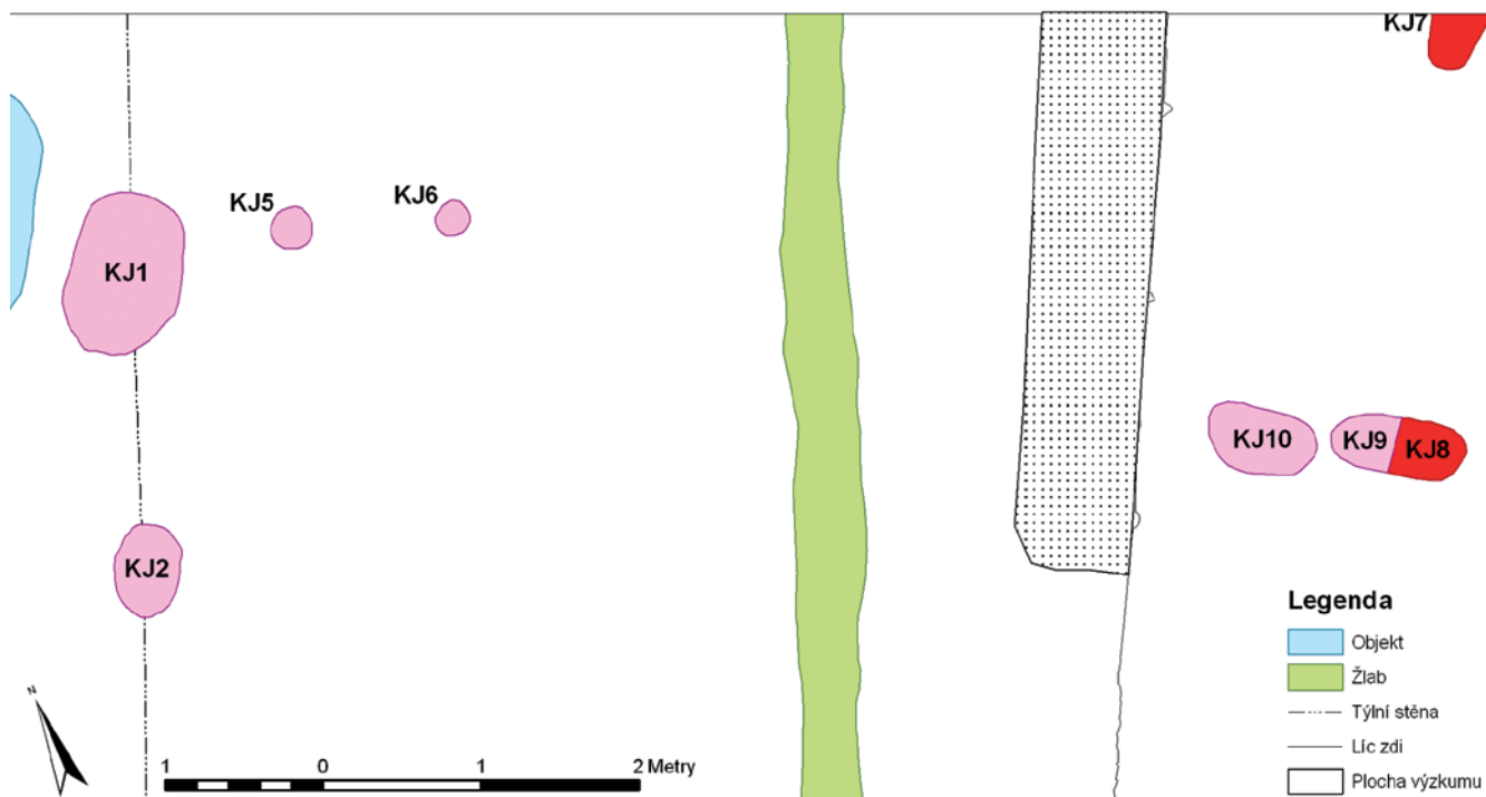
Obr. 170 – Výzkum R19. Kúlové jamky (červeně) v opozici k vyvrácené části čelní zdi (tečkovaně).

blízkosti hradby na vnější straně jsme odkryli soustavu kúlových jamek a žlábků (Obr. 170).