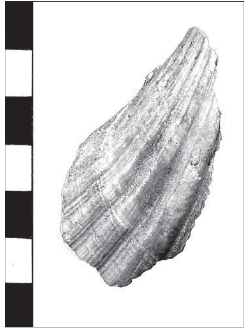
Ryc. 2. Fragment muszli pielgrzymiej z Góry Zamkowej w Cieszynie, stan. 1.