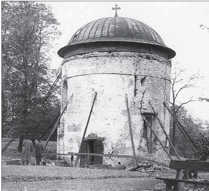
Ryc. 3. Rotunda św. Mikołaja i Waclawa na Górze Zamkowej w Cieszynie, stan przed rekonstrukcją (Muzeum Śląska Cieszyńskiego w Cieszynie).