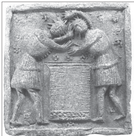
Obr. 4. Kachlica Bitka hráčov trik-traku, 2. polovica 15. storočia, MMB. Podľa Loskotová 2008, kat. č. 211.

Abb. 4. Kachel mit Rauferei zweier Tricktrackspieler, 2. Hälfte 15. Jhdt., Museum der Stadt Brno. Nach Loskotová 2008, Kat.-Nr. 211.