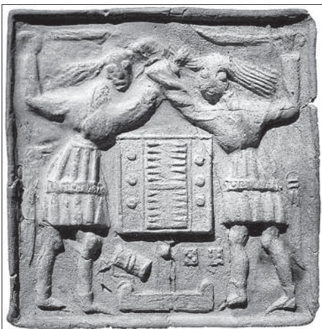
Obr. 5. Kachlica Bitka hráčov trik-traku, okolo polovice 15. storočia, Městské muzeum v Čelákovících. Podľa Skružný-Špaček 2004, kat. č. 23.

Abb. 4. Kachel mit Rauferei zweier Tricktrackspieler, 2. Hälfte 15. Jhdt., Museum der Stadt Brno. Nach Loskotová 2008, Kat.-Nr. 211.