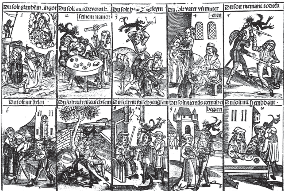
Obr. 2. Drevoryt Desaf božich prikázani, okolo 1460–1480, Štátna grafická zbirka v Mnichove. Podľa LCI 4, 1990, 565–566. Abb. 2. Holzschnitt der Zehn Gebote, um 1460–1480, Staatliche graphische Sammlung in München. Nach LCI 4, 1990, 565–566.