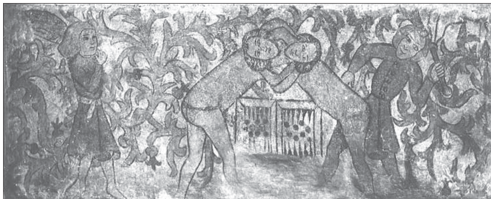
Obr. 7. Zvolenský zámok, Bitka hráčov trik-traku, transfer nástennej maľby zo starej fary vo Zvolene, okolo 1480.