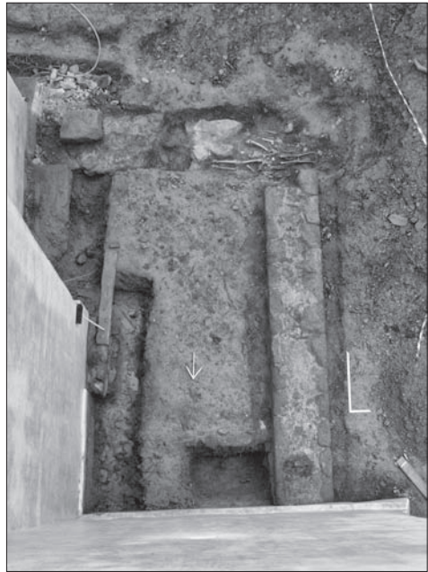
Obr. 4. Bukovec, okr. Domažlice, kostel Nanebevztí Panny Marie. Románské přístavba, pohled z věže kostela.

Pro sledování stratigrafického vztahu mezi touto zdí a románskou věží byla v místě jejich styku položena sonda 2/09 o rozměrech 100 × 150 cm. Bohužel sled vrstev byl v důsledku intenzivního pohřbívání zcela nečitelný a projevoval se jako homogenní hřbitovní vrstva. Nalezené pohřby patřily převážně novorozencům a věkové kategorii infans I. Koruna základu nalezené stavby byla o cca 15–18 cm výše než koruna základu věže. Nadzemní zdivo bylo strukturou totožné. Situace svědčí o sekundárním připojení stavby k již stojícímu kostelu. Vznik stavby lze datovat pouze obtížně. Struktura zdiva shodná s kostelem, niveleta základového vkopu i zjevná vazba ke kostelu a jeho komunikačnímu schématu naznačuje, že časový odstup od vzniku kostela nemohl být příliš velký.