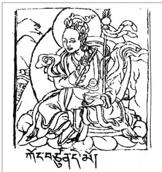
Obr. 12: Božstvo Kongcün Demo na kresbě z textu Bönri karčhag ( G.yung drung phun tshog ).

podivné pasáže týkající se uctívání místního božstva zmiňující „obcování“ s božstvem, tj. pohlavní styk ( bshos pa ), i zajímavý výraz zmiňující se o „pánu božstva“ ve smyslu „vlastníka božstva“ ( lha bdag ). Text zmiňuje uctívavné božstvo jako Demo ( De mo ) a je důležitým komparačním materiálem k mýtu o císaři Digum Cānpovi představeném v úryvku z Tibetské kroniky v části pojednávající o tunchuangských manuskriptech. Božstvo Demo je známé i z jiných tunchuangských pramenů jako hlavní božstvo oblasti Kongpo a je pravděpodobně spjaté s podzemní bytostí lu ( klu ) Ödebäde Ringmo či zkráceně De Ringmo , figurující ve zmíněném výše přeloženém mýtu z Tibetské kroniky .