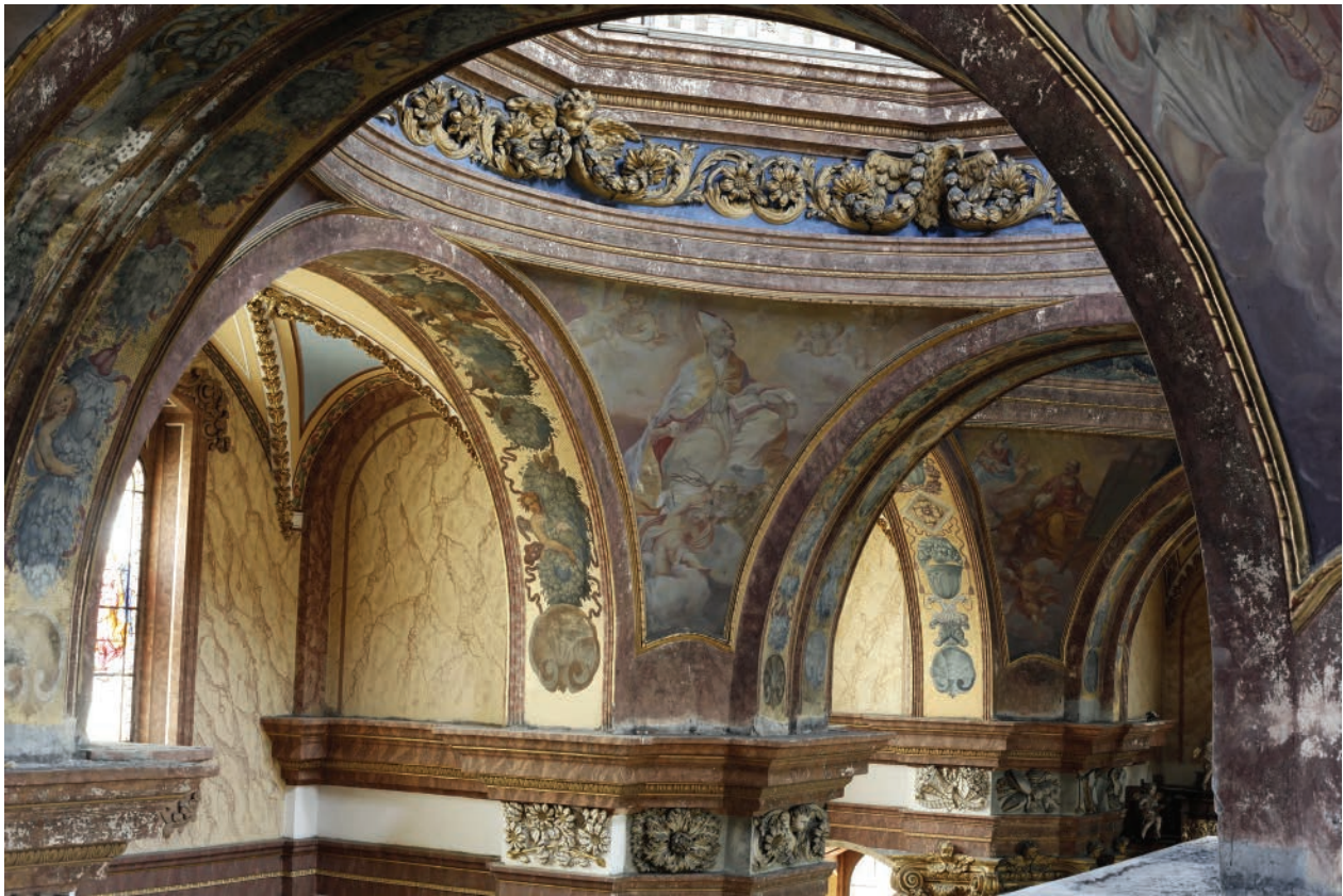
2 – Interiér kostela sv. Michala v Olomouci, pohled do centrální kupole

dassara Fontany. Fontanovým dílem jsou štukové dekorace hlavic sloupů, horizontálních vlysů v lodi a štuky v kupolích. Vzhledem k absenci archivních dokumentů datoval Mariusz Karpowicz jeho činnost pro dominikány do blíže neupřesněné doby v letech 1699–1706 a následně po roce 1710. 14 Předpokládal, že výzdoba byla požárem roku 1709 zničena, a tudíž ji Baldassare Fontana musel po roce 1710 opětovně realizovat nebo obnovit. K pevnému zakořenění mylné představy, že kostel vyhořel nebo byl těžce poškozen požárem z července 1709, přispěli staří olomoučtí historikové. 15 Lze předpokládat, že požár nedosáhl takového rozsahu, aby poškodil štukovou a malířskou výzdobu interiéru. Bylo by obtížně představitelné, že by nástěnné malby v pendentivech prokazatelně pohromu bez větších ztrát překonaly, zatímco štuky by lehly popelem. Lze vyloučit rovněž možnost, že by původní autoři svá díla vytvořili opětovně po požáru, neboť Innocenzo Monti v březnu 1710 zemřel. Soudím proto, že původní barokní fresky zůstaly navzdory požáru zachovány intaktně a byly pouze z dnešního pohledu poničeny razantními přemalbami Josefa Dragana z konce 19. století.