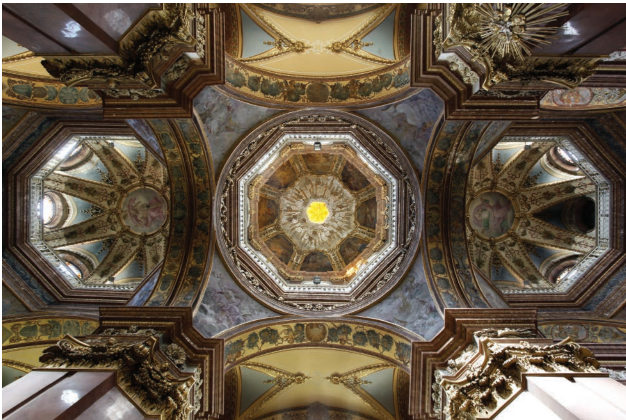
1 – Interiér kostela sv. Michala v Olomouci, pohled na všechny tři kupole

u Moravského Krumlova a pravděpodobně věnoval kostelu sv. Michala v Olomouci při organizovaných sbírkách finanční prostředky na jeho výzdobu. 6 Signaturu „J. Fried“ našel Leoš Mlčák na fresce s Pannou Marií. 7 Zřejmě se jednalo o malíře, který fresky v blíže neupřesněné době opravoval. 8 Joseph Dragan (1861–?) byl vídeňským malířem, který v kostele sv. Michala pracoval kolem roku 1898 ve funkci restaurátora. V duchu soudobých zvyklostí starší fresky z větší části přemaloval a několik polí nanovo vytvořil. Jeho vlastní prací, jak již uvedl Leoš Mlčák, je čtveřice fresek v presbytáři společně s malbou Poslední večeře, které nesou signaturu „Joseph Dragan. pinxit 1897“. 9 U všech uvedených nástěnných maleb v presbytáři není patrná rytá podkresba.