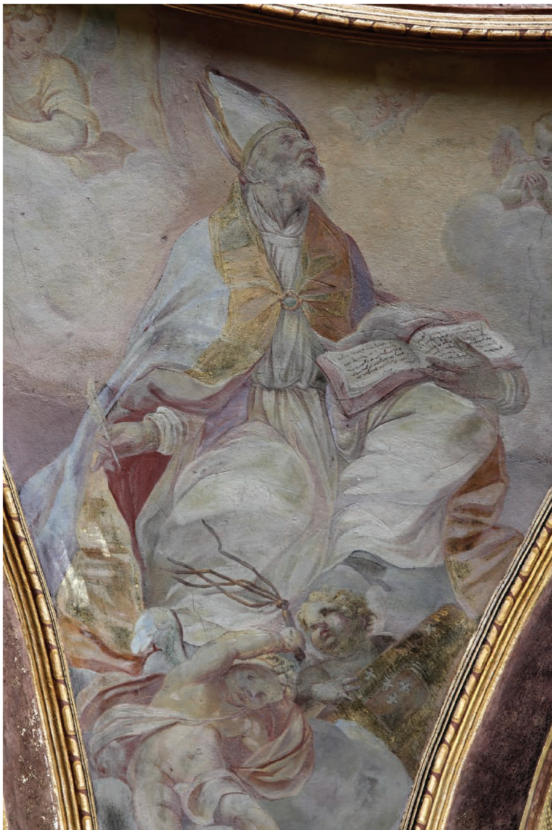
7 – Innocenzo Monti, Sv. Ambrož , nástěnná malba, před 1709. Olomouc, kostel sv. Michala