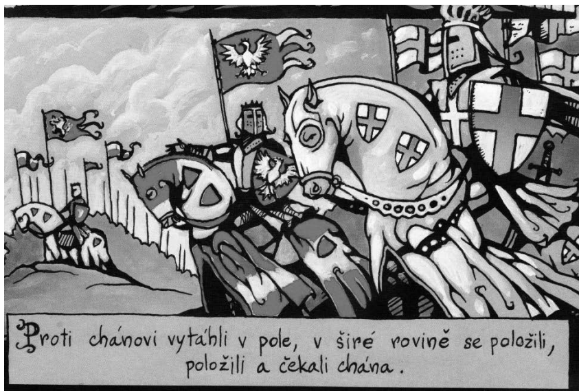
obr. 3 (cit. dílo, 2007, str. 7)

Ráz maleb dobrodružných komiksů je zachován i ve vykreslení krásné Kublajevny (v básni je líčena jako osoba, jež je „celá oblečena zlatohlavem, hrdlo, nadra měla odhalená, perlami, kameny ověčena“ – str. 6). Věrné přenesení tohoto slovního popisu do vizuální podoby však žánr komiksu dobrodružného a historického zčásti posouvá do oblasti komiksů erotických.