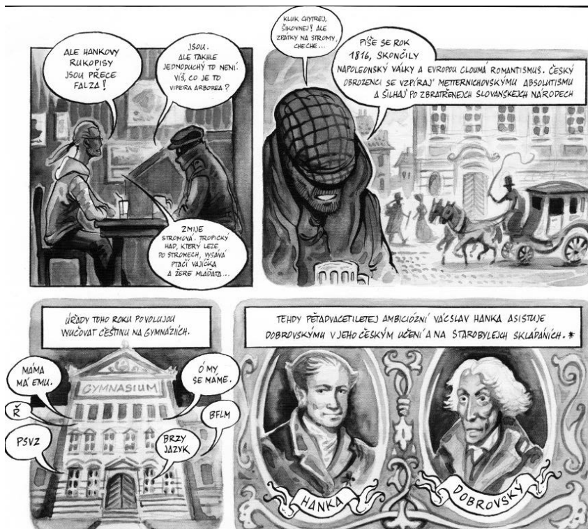
obr. 1 (cit. dílo, 2007, str. 14)