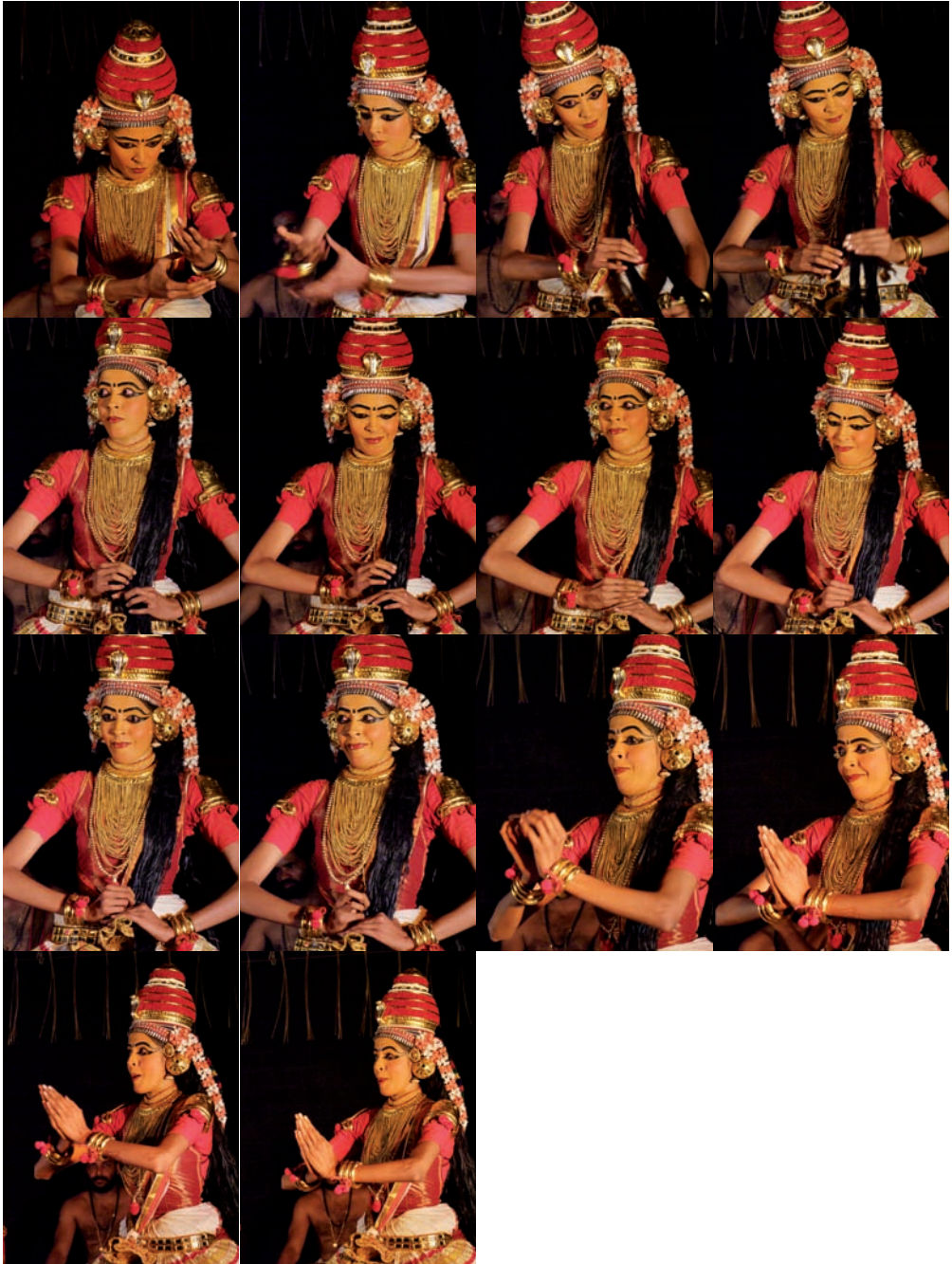
Kúdíjättam – sekvence muder 113–126