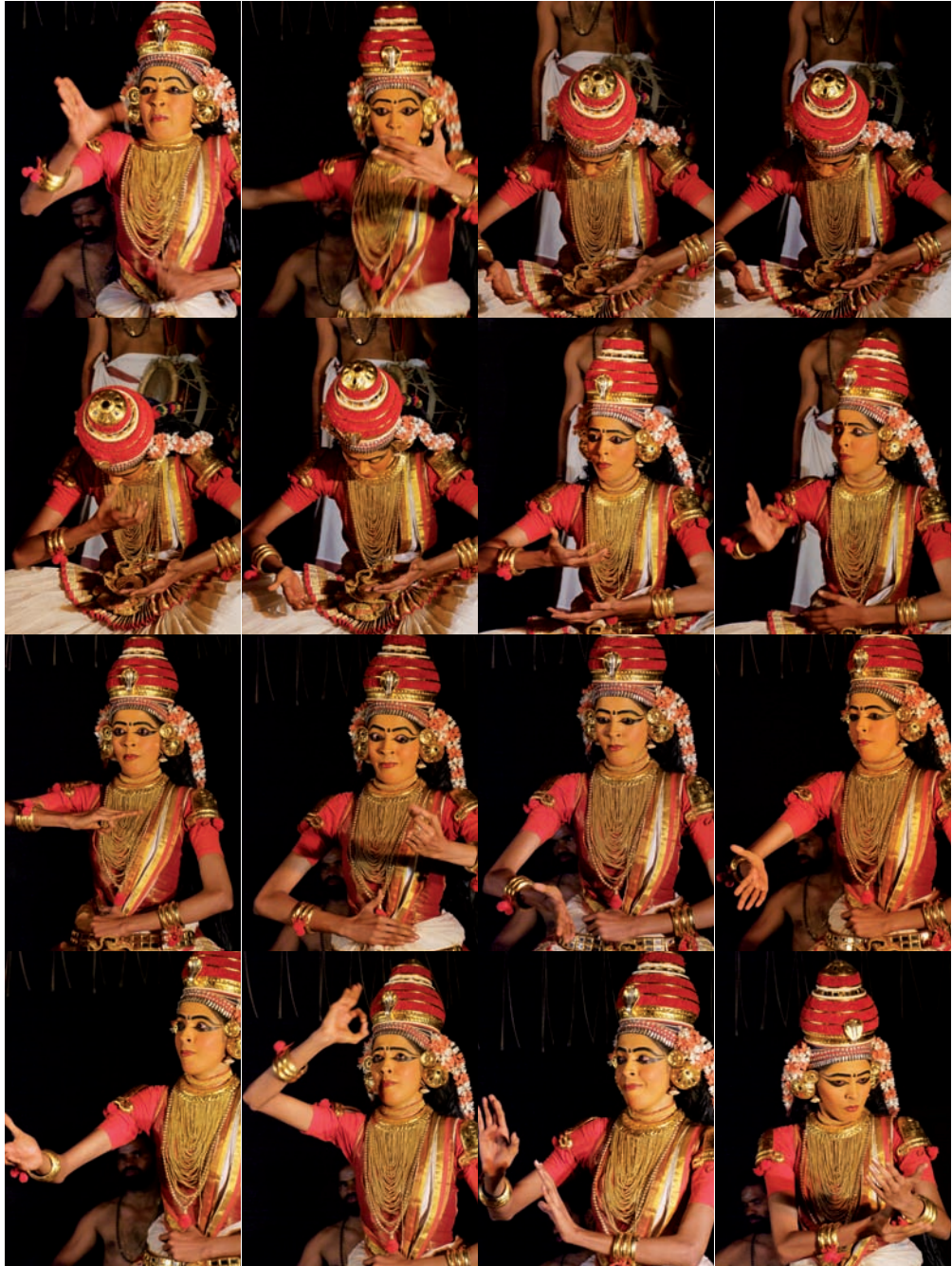
Kūḍijāttam – sekvence muder 97–112