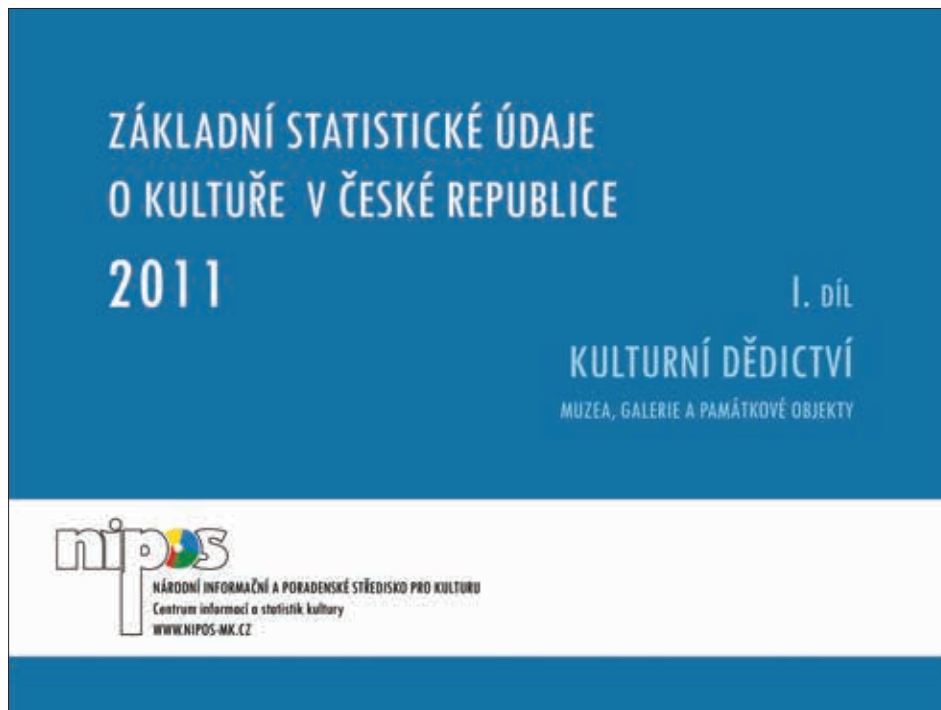
Obr. 2: Obálka příručky Základní statistické údaje o kultuře v České republice (za rok 2010).

ale v podrobnějším, později publikovaném přehledu jsou tyto nezveřejnitelné statistické jednotky uvedeny v anonymizované podobě a skutečné pořadí se pak může, někdy i zásadně, lišit.