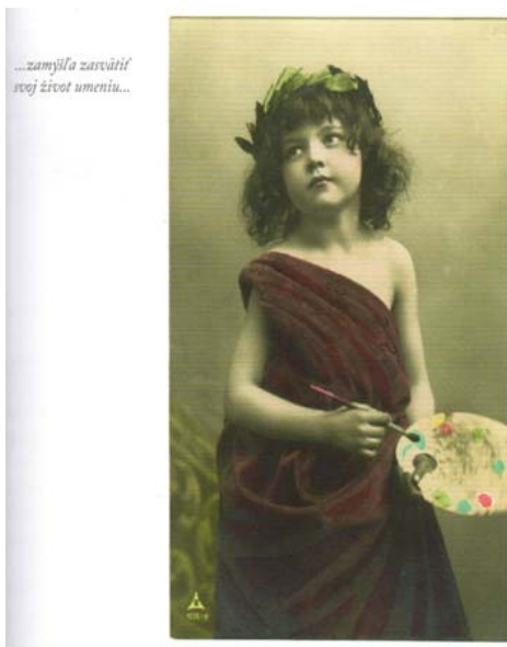
Obrázok č. 2

je vo vyššom veku a ktorý zažil prednovembrový režim, cez exotický námiet v ňom nájde mnoho vecí, ktoré dôverne pozná.