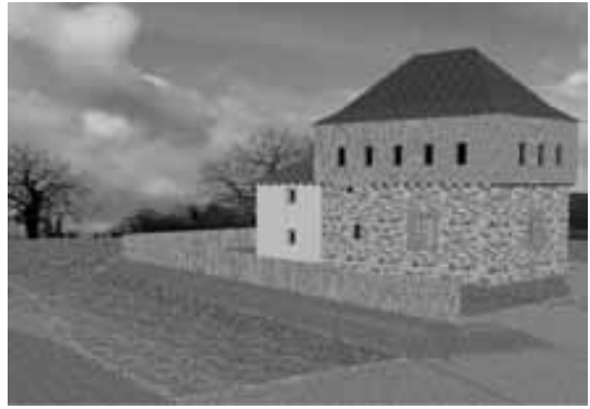
Obr. 6. Srovnání současného stavu tvrze s možnou podobou po rekonstrukci. Celkový pohled přes vodní příkop od severozápadu.

Abb. 6. Vergleich des derzeitigen Zustandes der Festung mit möglichem Aussehen nach der Rekonstruktion: Gesamtansicht über den Wassergraben von Nordwesten.