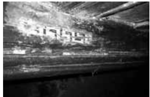
Obr. 3. Hruškově profilovaný trámový strop v mezipatře nosislavské tvrze – na pravém obrázku zbytky původní malby stropu, vlevo pod stropem klenby původního okenního otvoru v severní zdi.

Abb. 3. Birnenförmig profilierte Balkendecke im Zwischenstock der Nosislaver Festung – auf dem rechten Bild Reste der ursprünglichen Deckenmalerei, links unter der Gewölbedecke der ursprünglichen Fensteröffnung in der Nordwand.