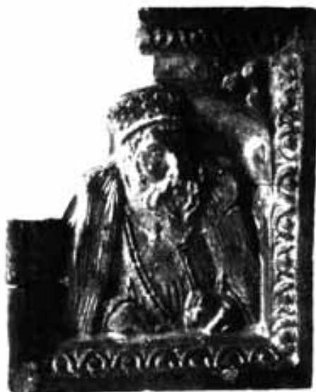
Obr. 13. Lüneburg-Altstadt 29. Zlomek kachle se saským kurfiřtem Janem Fridrichem II. Podle Ring 2007a, Abb. 7a.

Abb. 12: Lüneburg-Altstadt 29. Kachelfragment mit sächsischem Kurfürst Johann Friedrich I. Nach Ring 2007a, Abb. 6a.