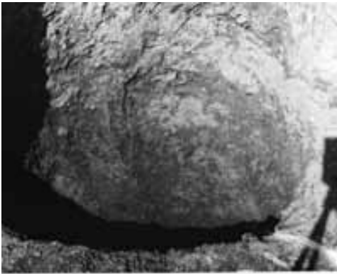
Obr. 5. Opava, Krnovská ulice. Jáma č. 1 druhotně využitá k deponování odpadu z hrnčířské dílny. Abb. 5. Opava-Krnovská-Str. Grube Nr. 1, sekundär für Abfall aus der Töpferwerkstatt genutzt.

Krásá 2008, 159 č. 530, 530–537, 163–164). Z uvedené charakteristiky se vymyká jediná forma, z níž se zachoval jen nevelký okrajový fragment (délka 169 mm, šířka 115 mm, výška včetně opěrné nožky 57 mm), zhotovený z jemně plavené písčité kaolínové hlíny, vypálené do světle šedé barvy s tmavším šedým lomem (obr. 7). Na svrchní, ke středu mírně prohnuté straně (rubové) je opatřen hruškovitým, horizontálně seříznutým masivním držadlem (opěrnou nožkou) a blíže k okraji umístěným plochým kupovitým nálepem, v jejichž okolí jsou patrné krouživé stopy po uhlazování. Opačná pracovní strana (lícová) má prázdnou středovou plochu a negativní reliéf, zachovaný v podobě profilovaného rámování spodního rohu kachlové lišty, je zdoben pásem negativního oběžného vejcovcového ornamentu, který ve spodní části přerušuje vložený letopočet