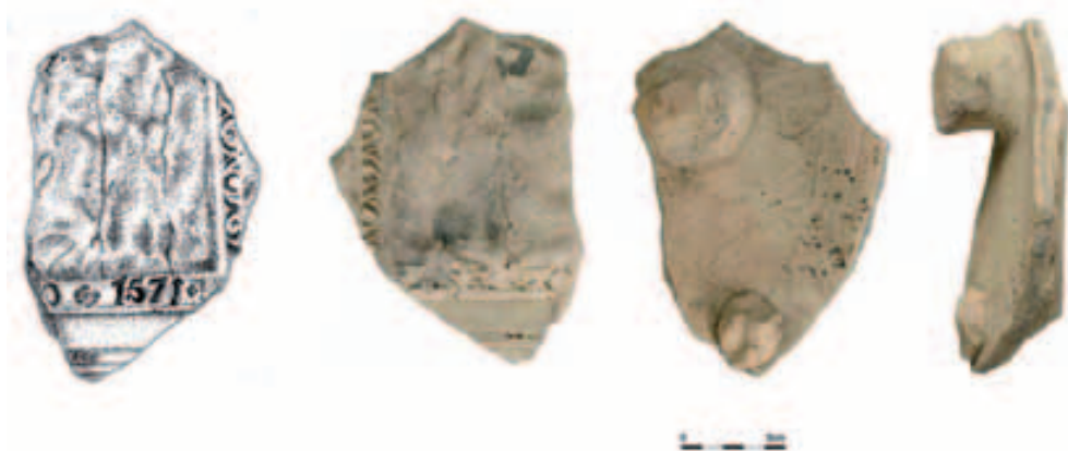
Obr. 7. Opava, Krnovská ulice. Keramický kadlub určený k profilovanému rámování kachlových listů s letopočtem 1571.

Abb. 7. Opava-Krnovská-Str. Zur profilierten Rahmung von Kachelleisten bestimmter Keramikmodel mit Jahreszahl 1571.