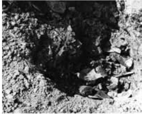
Obr. 4. Opava, Krnovská ulice. Zásyp jámy č. 1 s hrnčířskou deponií. Fotoarchiv SZM. Abb. 4. Opava-Krnovská-Str.-Str. Verfüllung von Grube Nr. 1 mit Deponie einer Töpferei. Fotoarchiv des Schlesischen Landesmuseums.