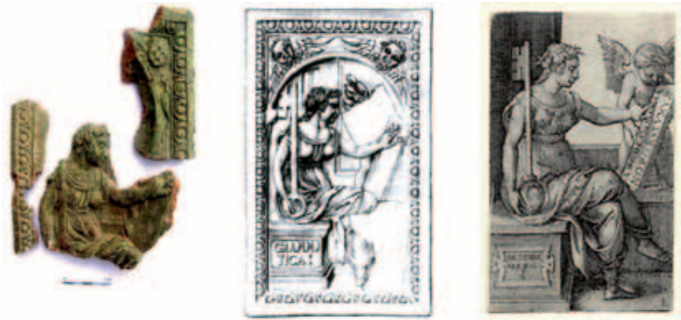
Obr. 8. Janovice u Rýmařova. Zlomky kachle s alegorií Gramatiky včetně kresebné rekonstrukce a grafické předlohy Georga Pencze. kresba Karel 1997, 67; grafický list Bartsch 1980, č. 110, 125.

Abb. 8. Janovice bei Rýmařov. Kachelfragmente mit Allegorie der Grammatik einschließlich