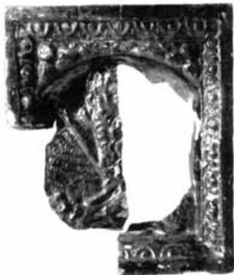
Obr. 12. Lüneburg-Altstadt 29. Zlomek kachle se saským kurfiřtem Janem Fridrichem I. Podle Ring 2007a, Abb. 6a.

Abb. 12: Lüneburg-Altstadt 29. Kachelfragment mit sächsischem Kurfürst Johann Friedrich I. Nach Ring 2007a, Abb. 6a.