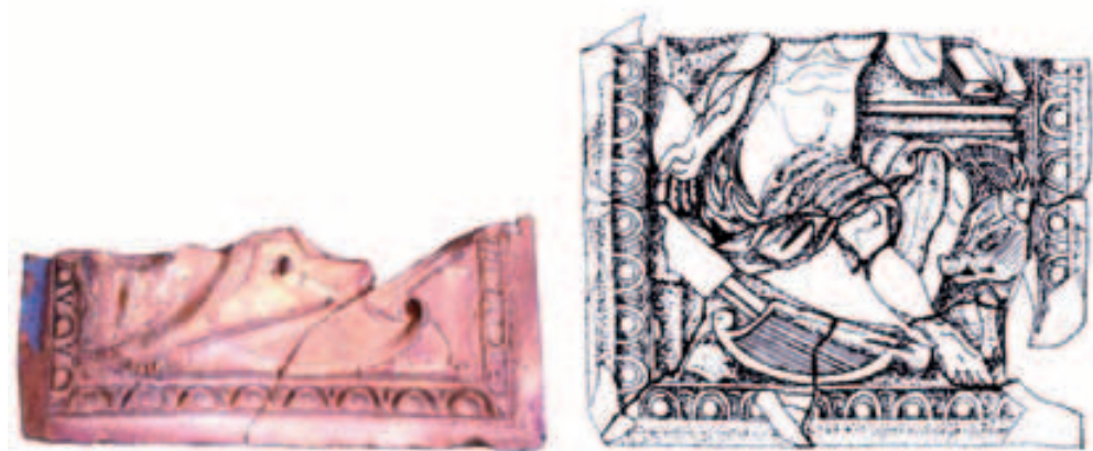
Obr. 11. Lüneburg-Altstadt 29. Zlomek kachle s alegorií sluchu (Auditus) včetně kresebné rekonstrukce. Podle Ring 2009, Abb. 3.