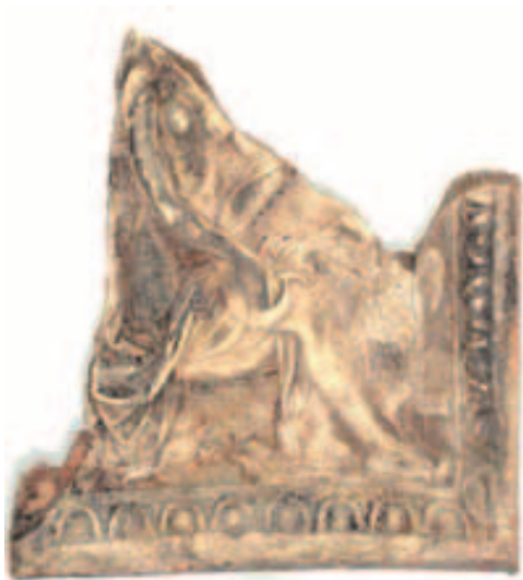
Obr. 10. Lüneburg-Altstadt 29. Zlomek kachle s vyobrazením alegorie čichu (Odoratus) včetně kresebné rekonstrukce.

Abb. 10: Lüneburg-Altstadt 29. Kachelfragment mit Darstellung der Allegorie des Geruchsinns (Odoratus) einschließlich Rekonstruktionszeichnung.