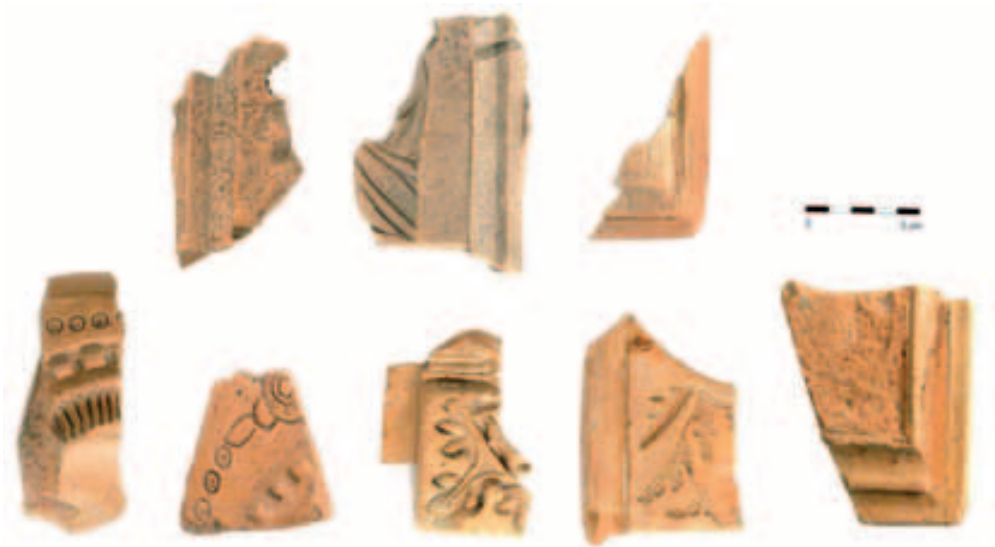
Obr. 6. Opava, Krnovská ulice. Zlomky kadlubů z výzkumů SZM (Krnovská 4 – nahore) a NPÚ, ú. o. p. v Ostravě (Krnovská 17 – dole).