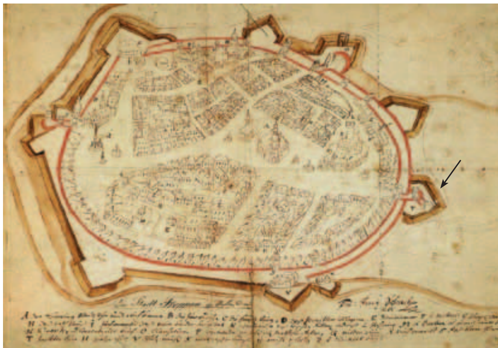
Obr. 2. Poloha Jaktaršské brány na kolorované perokresbě městského radního Ferdinanda Schwartzera, kolem roku 1700. Podle Žáček 2006.

Abb. 2. Lage des Jaktar-Tors auf einer kolorierten Federzeichnung des Stadtrates Ferdinand Schwartzer, um 1700. Nach Žáček 2006.