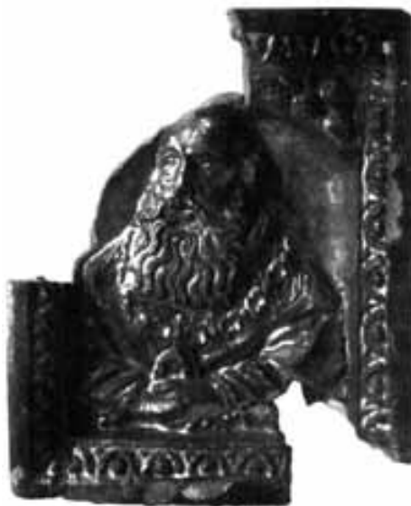
Obr. 15. Lüneburg-Altstadt 29. Zlomek kachle s kurfiřtem Jiřím Saským. Podle Ring 2007a, Abb. 8.

Abb. 14. Lüneburg-Altstadt 29. Fragment eines Modells mit sächsischem Kurfürst Johann Wilhelm. Nach Ring 2007a, Abb. 7b.