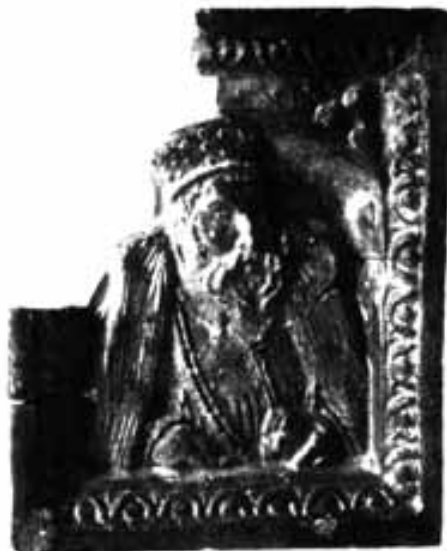
Obr. 13. Lüneburg-Altstadt 29. Zlomek kachle se saským kurfiřtem Janem Fridrichem II. Podle Ring 2007a, Abb. 7a.

Abb. 12: Lüneburg-Altstadt 29. Kachelfragment mit sächsischem Kurfürst Johann Friedrich I. Nach Ring 2007a, Abb. 6a.