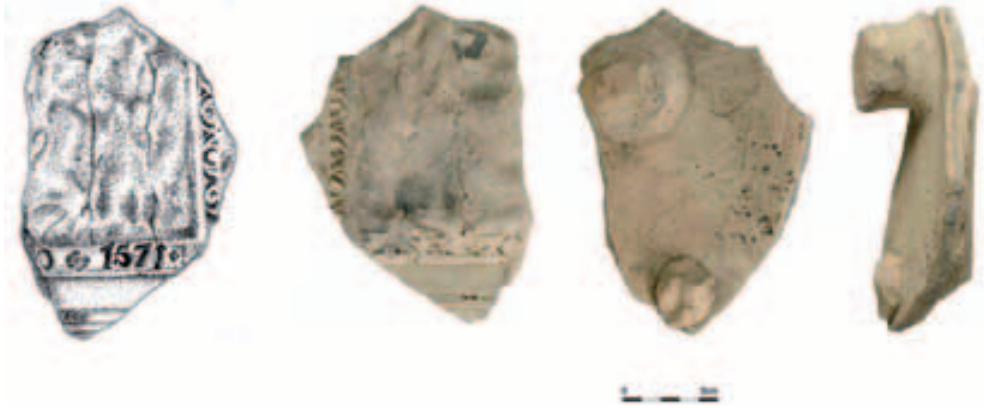
Obr. 7. Opava, Krnovská ulice. Keramický kadlub určený k profilovanému rámování kachlových listů s letopočtem 1571.

Abb. 7. Opava-Krnovská-Str. Zur profilierten Rahmung von Kachelleisten bestimmter Keramikmodel mit Jahreszahl 1571.