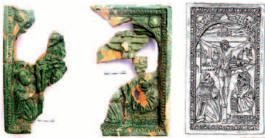
Obr. 9. Janovice u Rýmařova. Zlomky kachlů s Ukřížováním včetně kresebné rekonstrukce. Foto L. Hlubek; kresba Karel 1997, 67.

Abb. 9. Janovice bei Rýmařov. Kachelfragmente mit Jesus am Kreuz einschließlich Rekonstruktionszeichnung. Foto L. Hlubek; Zeichnung Karel 1997, 67.